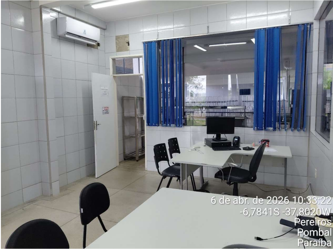
Foto 10- Administração do Restaurante Universitário- UFCG/CCTA.