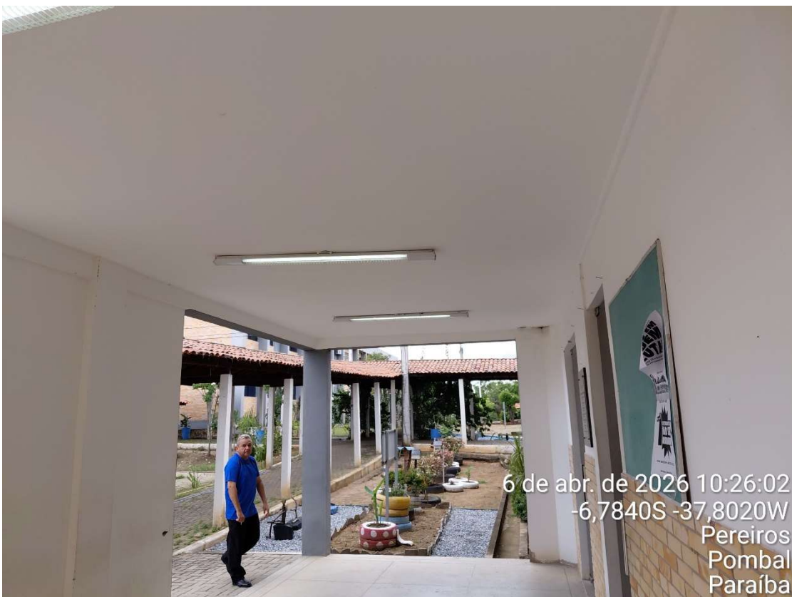
Foto 4- WC externo do Restaurante Universitário- UFCG/CCTA.

6 de abr. de 2026 10:26:02 -6,7840S -37,8020W Pereiros Pombal Paraíba