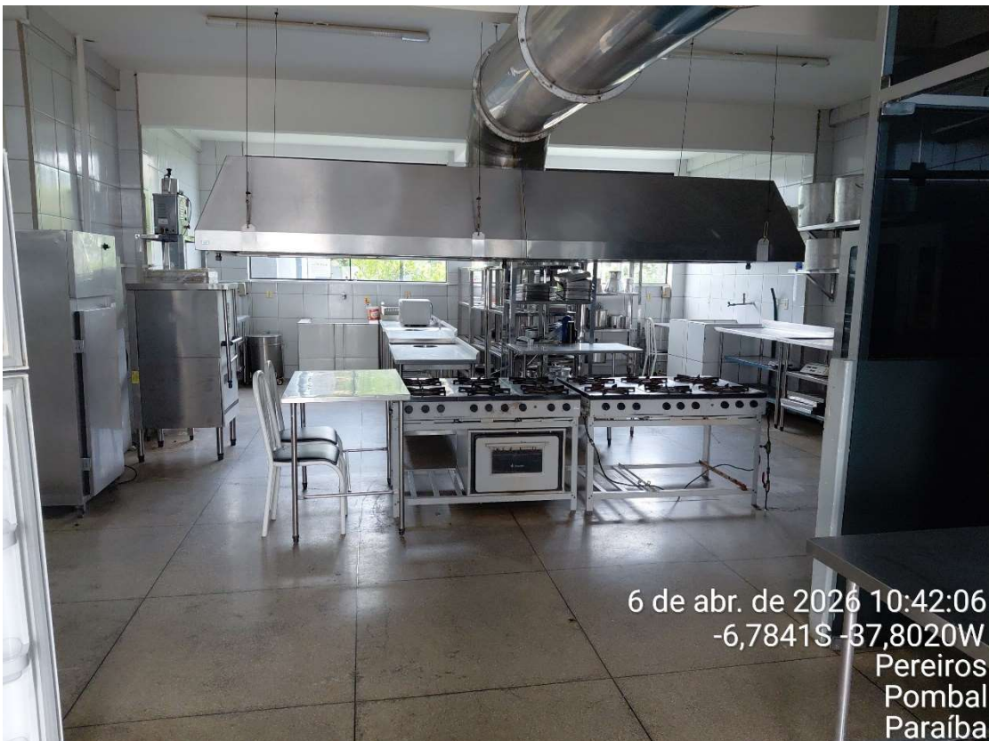
Foto 7- Cozinha do Restaurante Universitário- UFCG/CCTA.