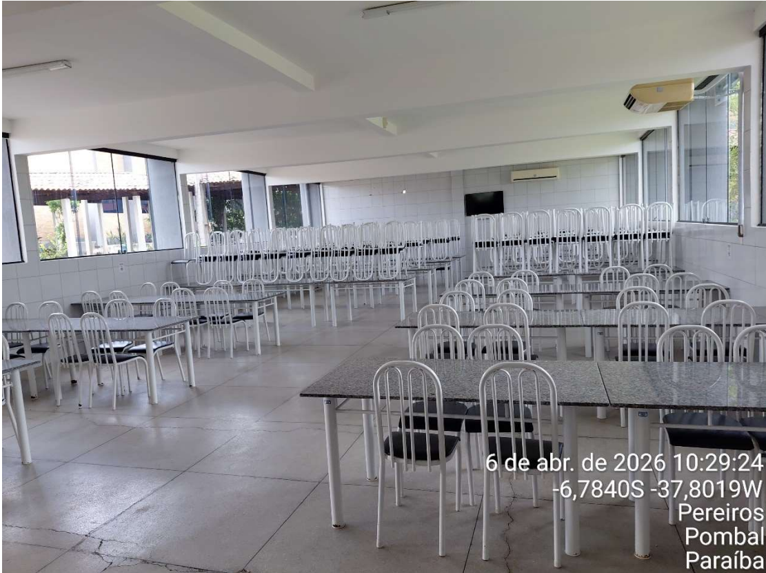
Foto 6- Refeitório do Restaurante Universitário- UFCG/CCTA.