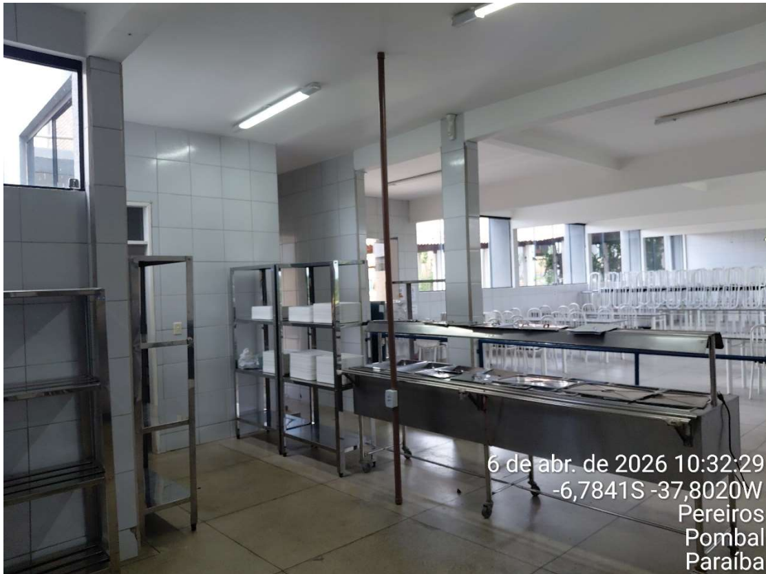
Foto 8- Cozinha do Restaurante Universitário- UFCG/CCTA.