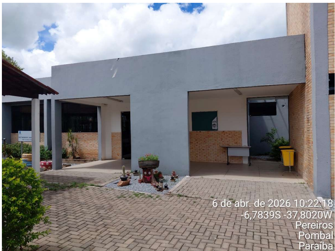
Foto 3- Fachada do Restaurante Universitário- UFPG/CCTA.