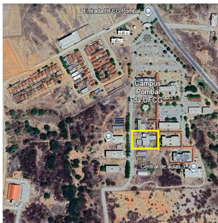
Foto 1- Localização do Imóvel Avaliando e entorno.

O imóvel em avaliação está localizado na coordenada geográfica 6°46'58"S 37°48'06"W e altitude de 193 m, no bairro dos Pereiros, cidade de POMBAL/PB. Nas proximidades do imóvel consta a área densamente habitada com residências e vê-se diversos equipamentos de ensino (a exemplo do CAIC, Escola Newton Seixa, Escola Belarmino da França, outras) de saúde (UP 24 horas), de tratamento de esgoto, bem como o Rio Piancó.