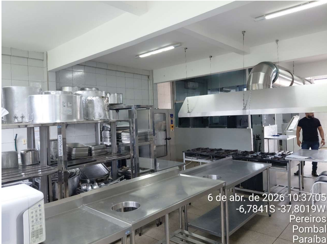
Foto 9- Cozinha do Restaurante Universitário- UFCG/CCTA.