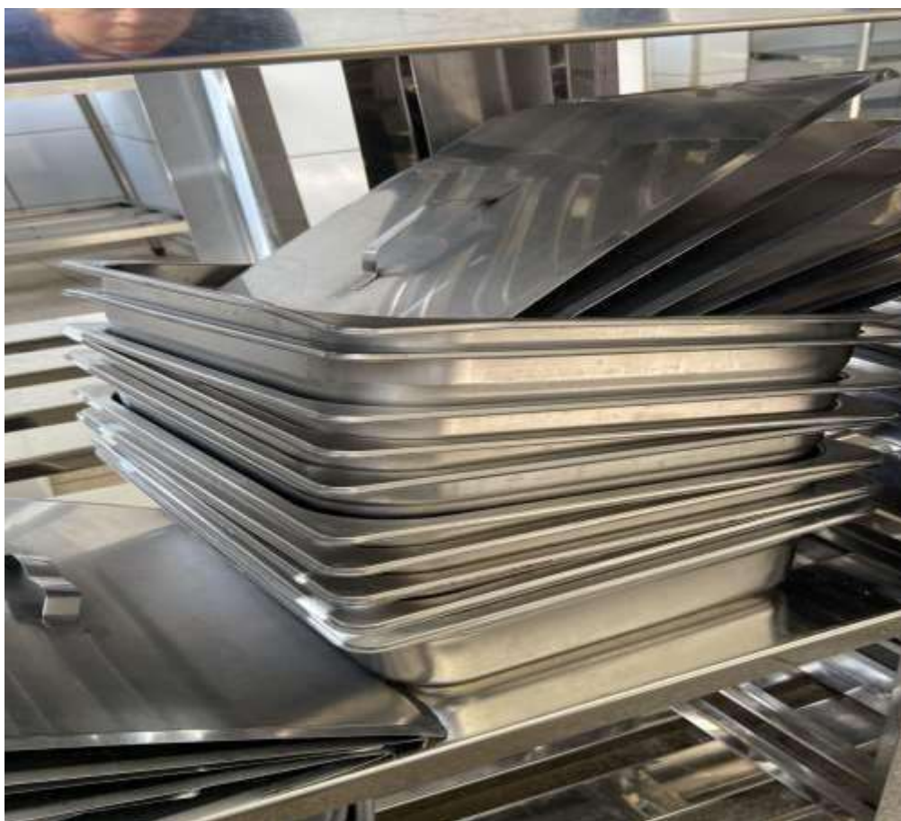
CUBAS PEQUENAS 10 UNIDADES