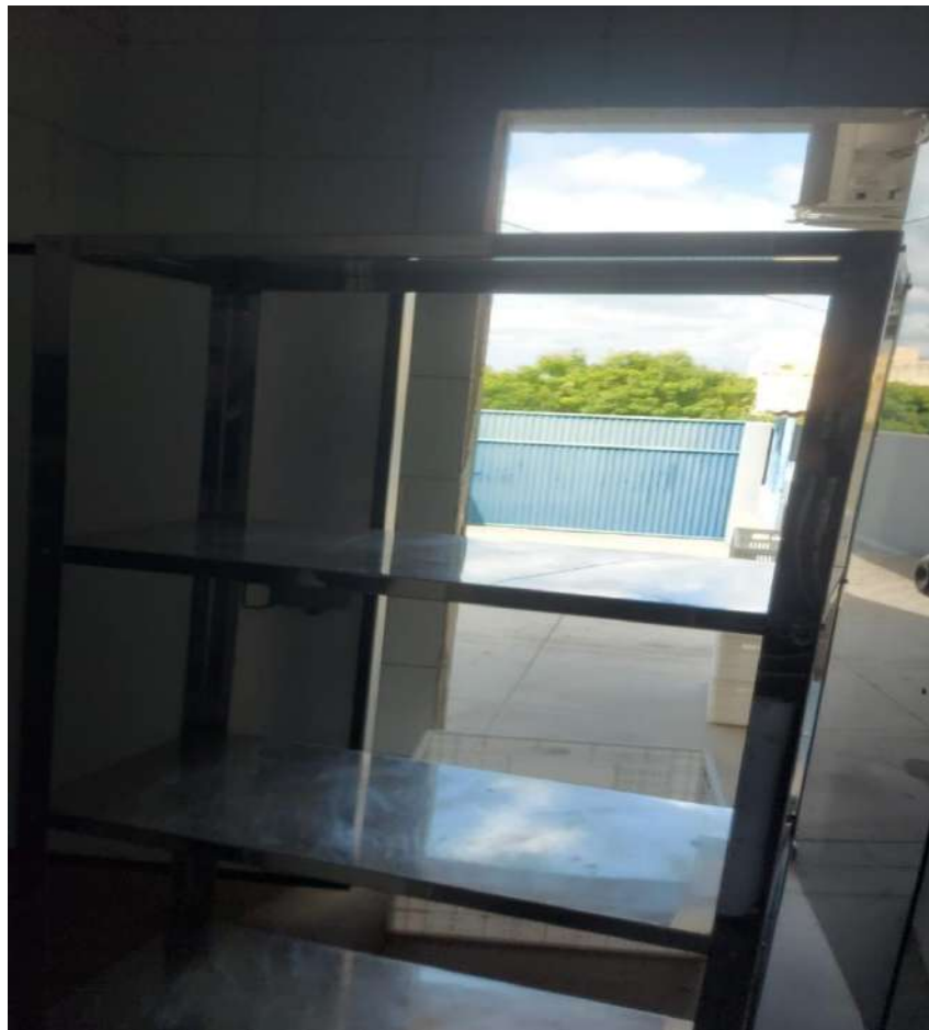
ESTANTE MADEIRA OU METALICA ESTANTE EM ACO, LISA, 4 PLANOSUSI14. Tombo - 132822