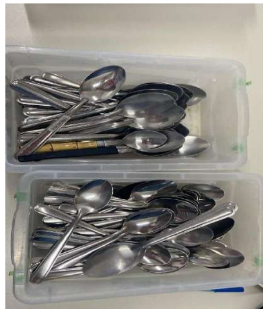
COLHER 100 UNIDADES