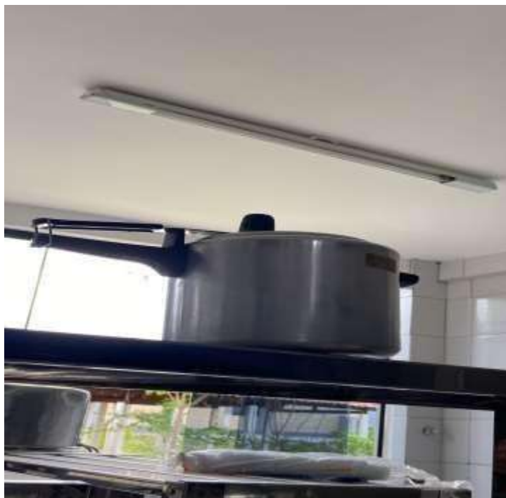
PANELA DE PRESSÃO 4,5L