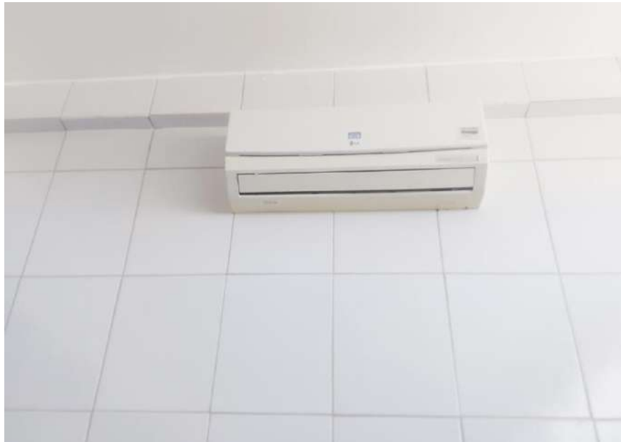
Tombo - 099729