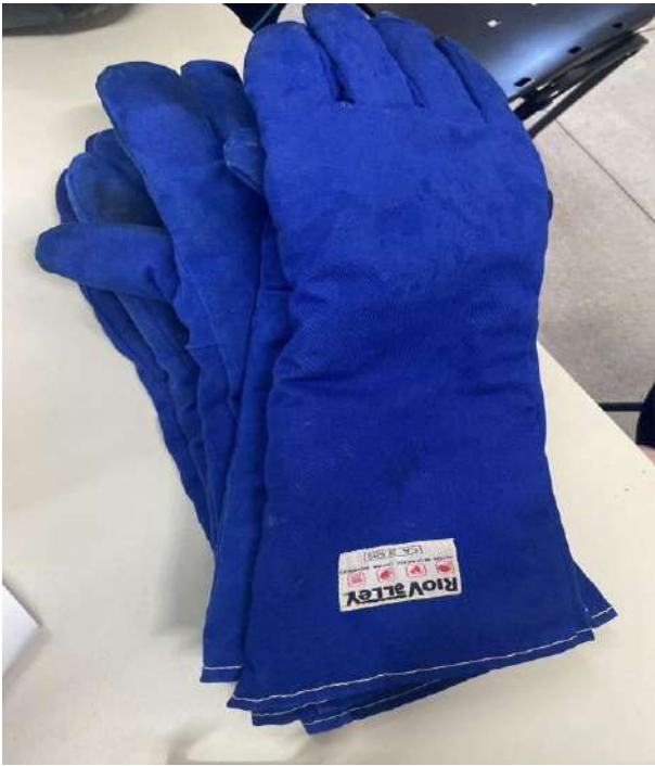
LUVAS DE PANO AZUL 03 UNIDADES