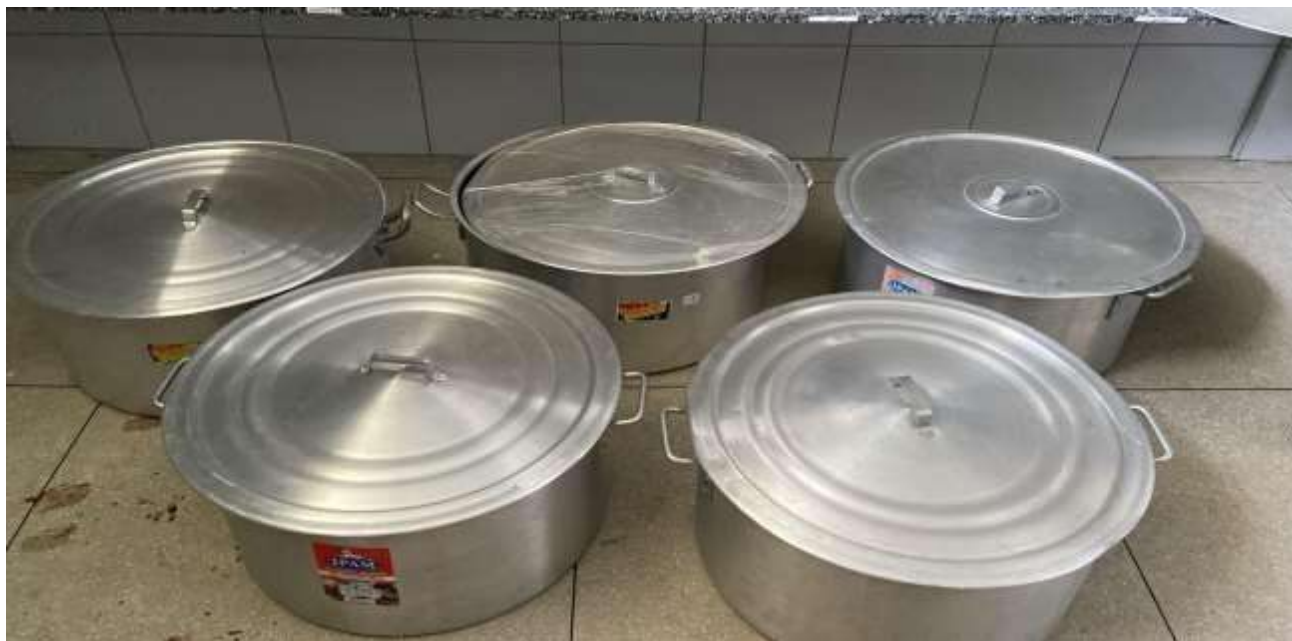
CAÇAROLA S12 UNIDADES.