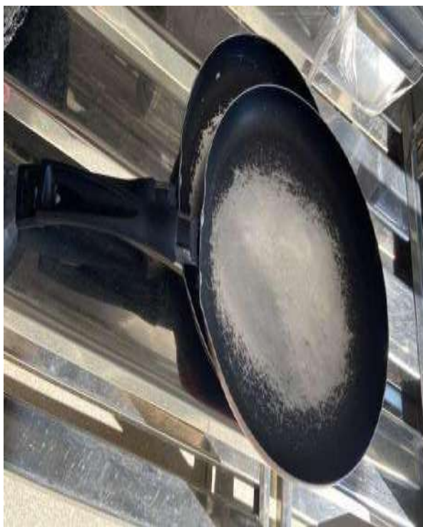
FRIGIDEIRAS PEQUENAS 02 UNIDADES