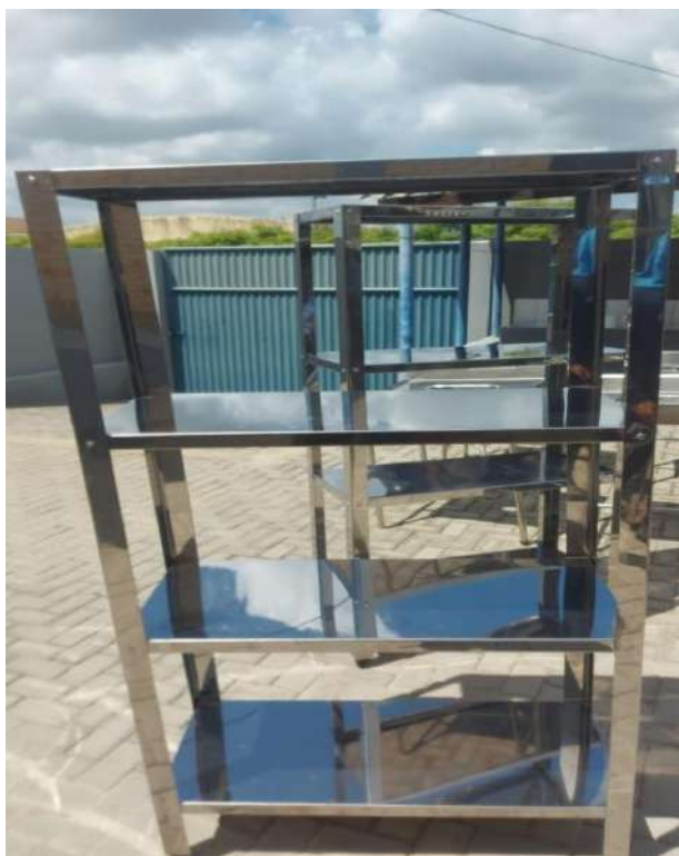
ESTANTE MADEIRA OU METALICA ESTATE EM ACO, LISA, 4 PLANOSUSI14. Tombo - 132818