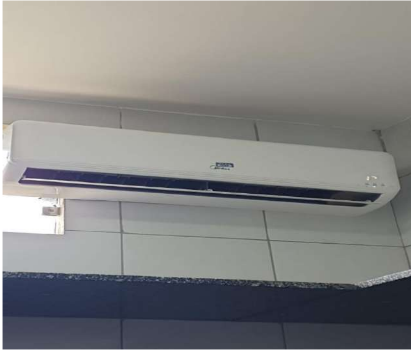
Tombo - 131879 (funciona)