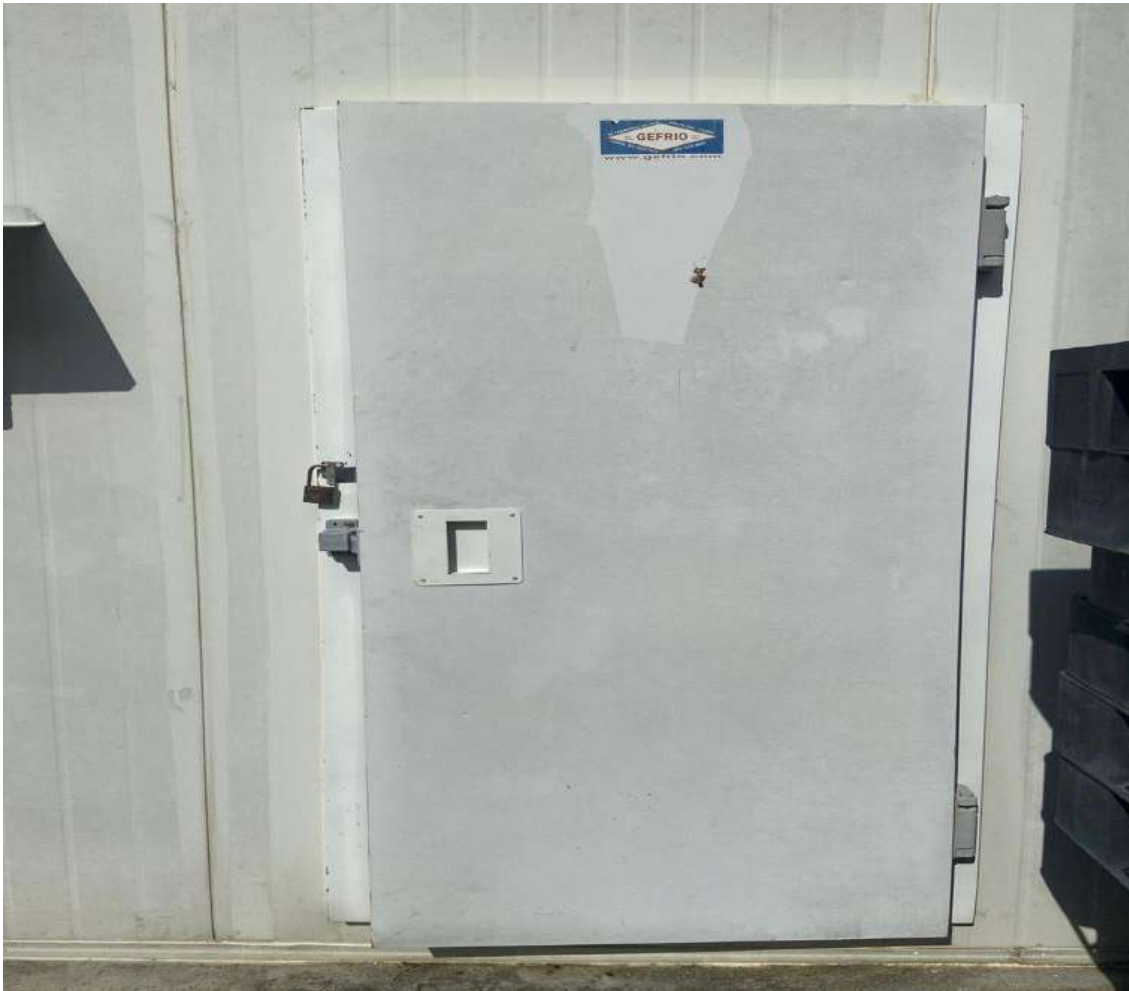
CAMARA FRIGORIFICA PARA CONGELAMENTOGEFRIO. Tombo - 133394 (funciona)