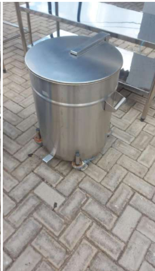
CARRINHO COLETOR DE LIXO CARRO INOX, COM RODAS, PARA COLETA DE RESIDUOSGRUNOX.Tombo - 133396 e sem tomo