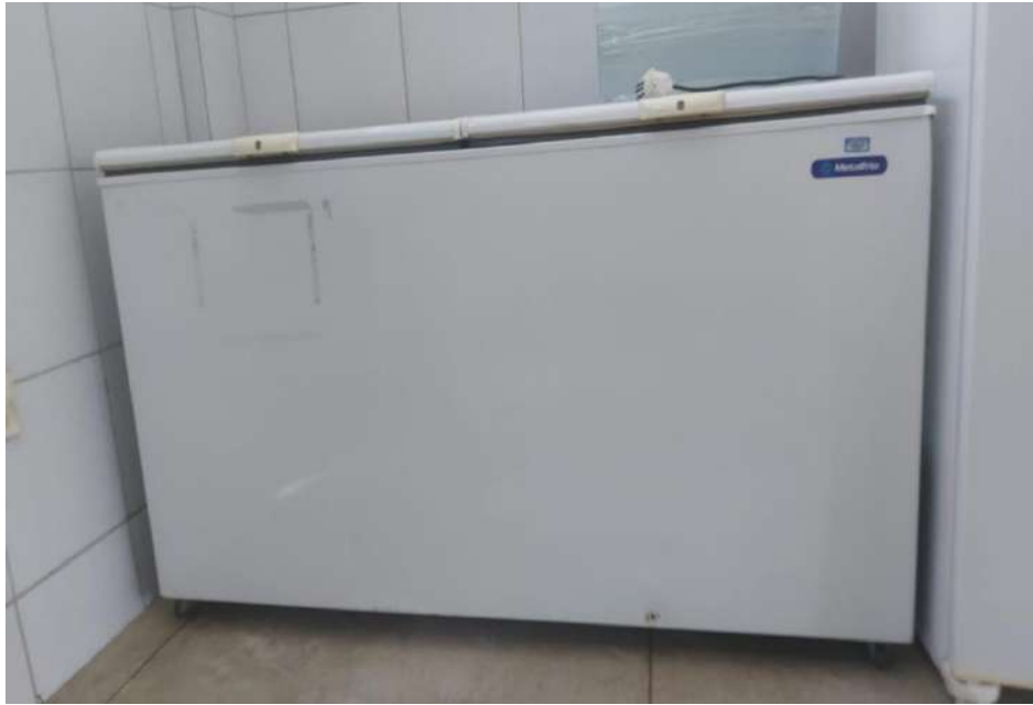
FREEZER HORIZONTAL, BRANCOMETALFRIO. Tombo – 132427 (não funciona, precisa de manutenção)