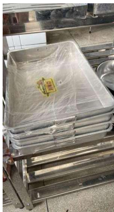
ASSADEIRA DE ALUMÍNIO 04 UNIDADES.