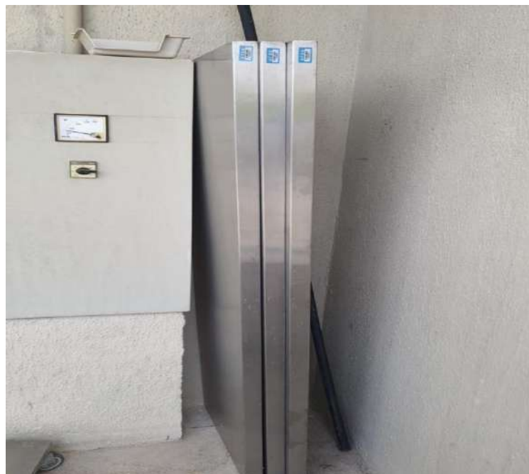
PRATELEIRA MADEIRA OU METALICALISA FABRICADA EM ACO INOX ARTFRIO. Tombos - 132839, 132840, 132841 (03 unidades)