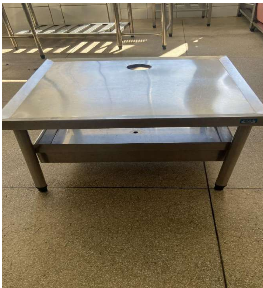
MESA DECANTADORA EM ACO INOXGRUNOX. Tombo - 133408