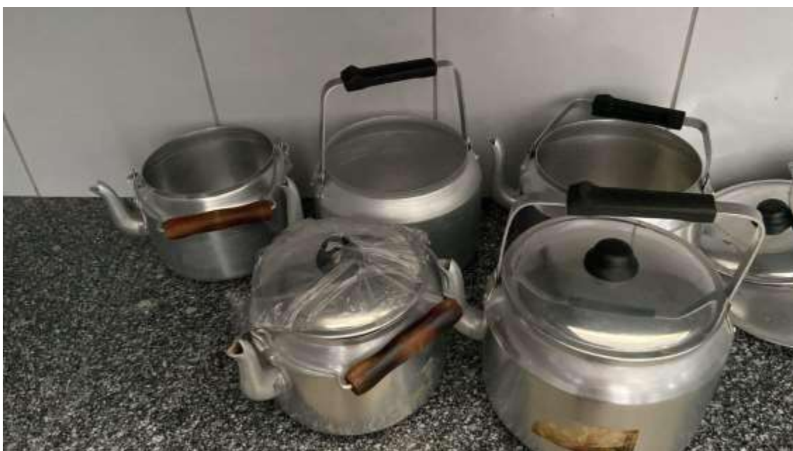
CHALEIRAS 05 UNIDADES.