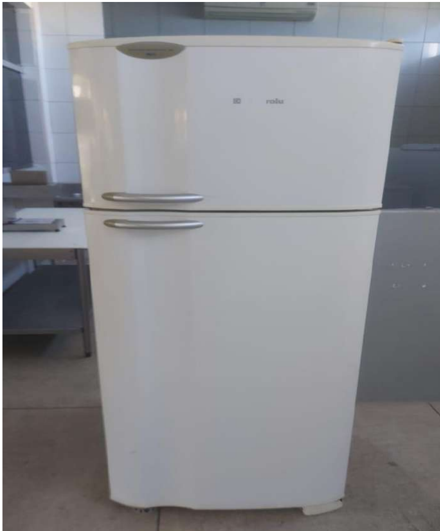
Geladeira Sem tombo (não funciona, precisa de manutenção)