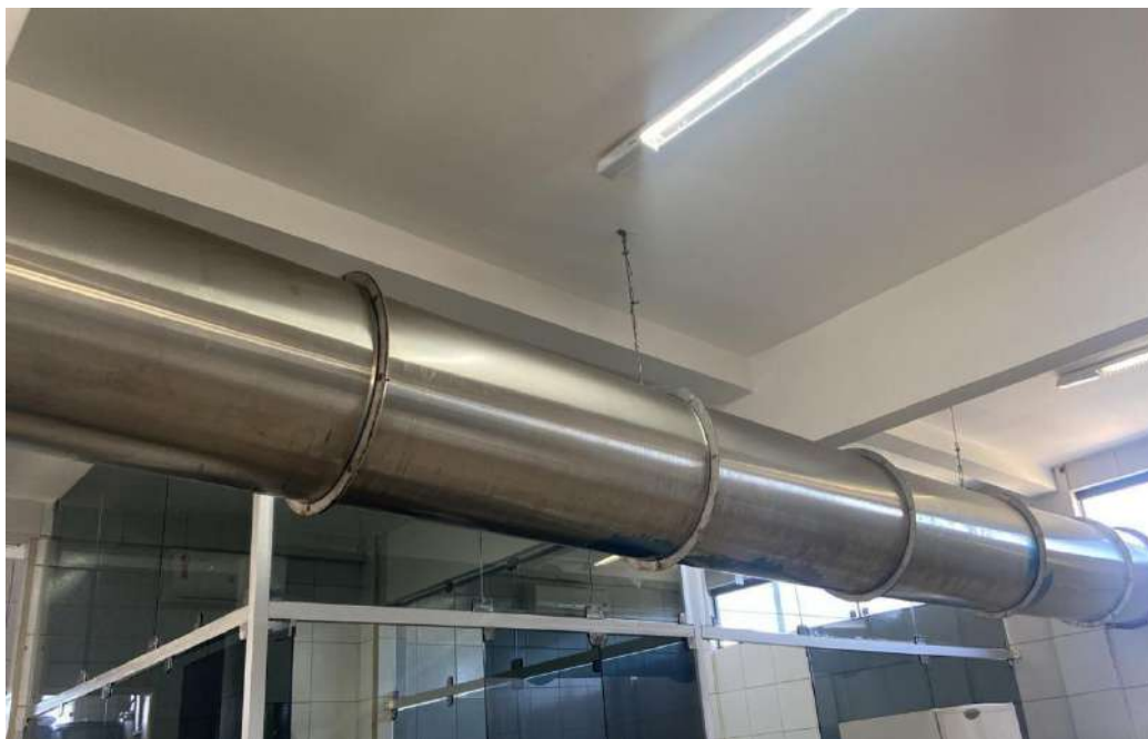
Conjugado com a peça de cima