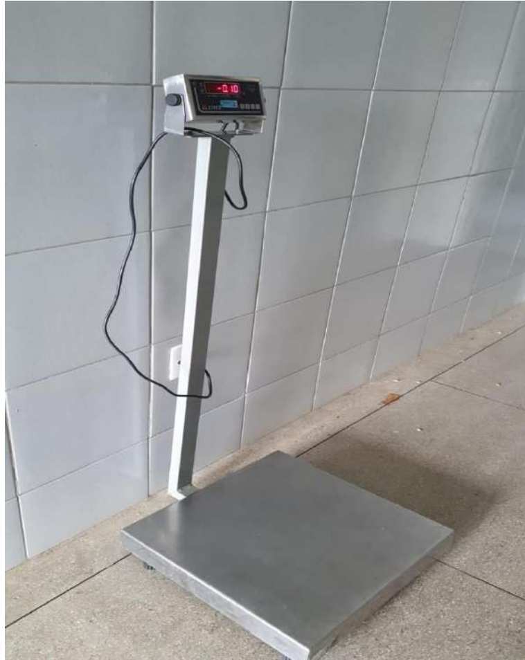
Tombo – 099514 (funciona)