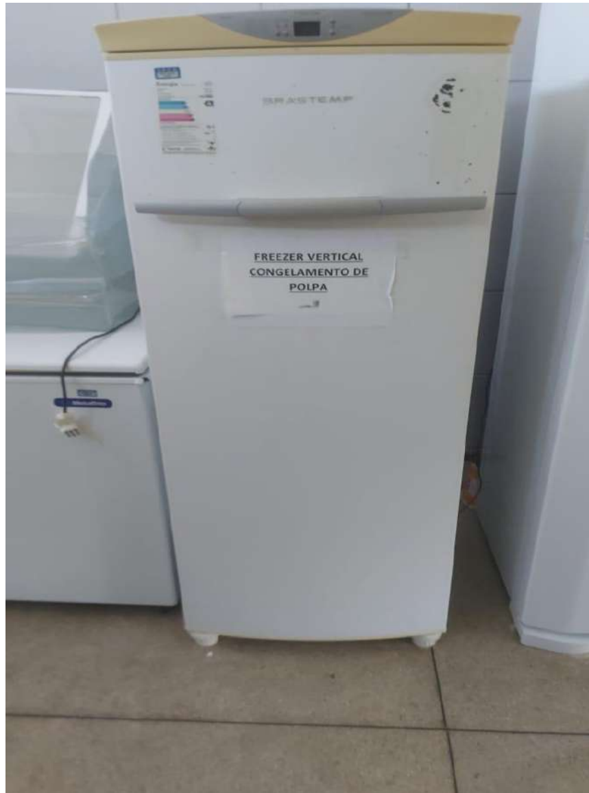
Tombo – 019694 (não funciona, precisa de manutenção)