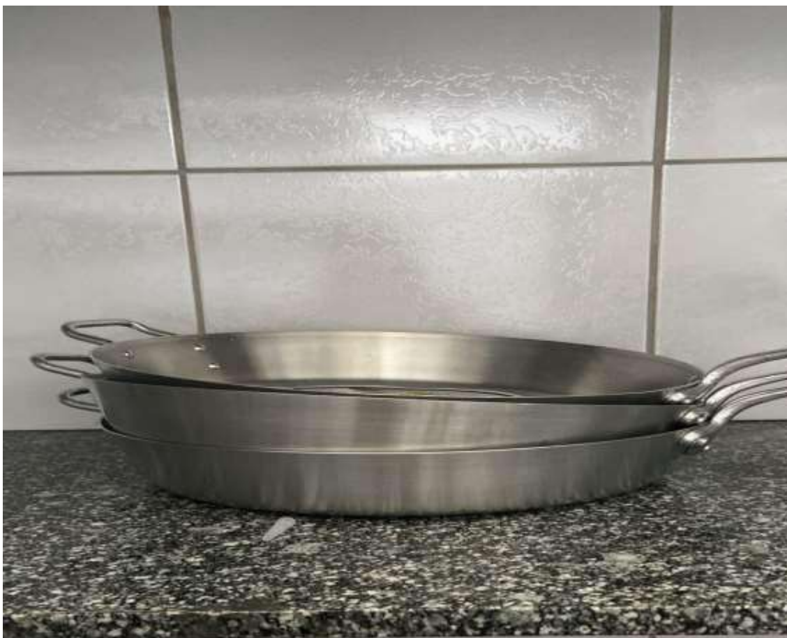
FRIGIDEIRAS HOTEL 03 UNIDADES