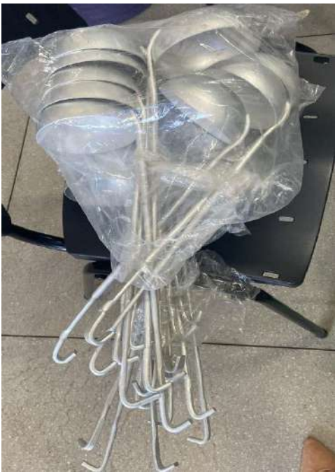
CONCHAS GRANDES 15 UNIDADES