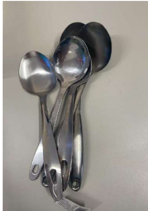
COLHERES GRANDES 05 UNIDADES.