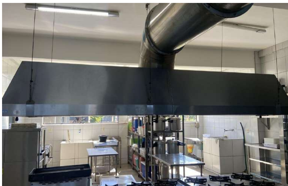
COIFA PARA FOGAO, EM ACOGRUNOX. Tombo - 133546