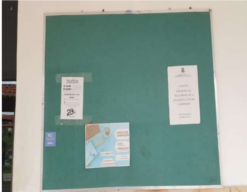
Tombo - 098878