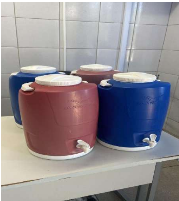
GARRAFAS TÉRMICAS 4 UNIDADES.