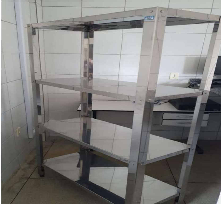
ESTANTE MADEIRA OU METALICA ESTANTE EM ACO, LISA, 4 PLANOSUSI14. Tombo - 132825, 132823, 132821 (03 unidades)