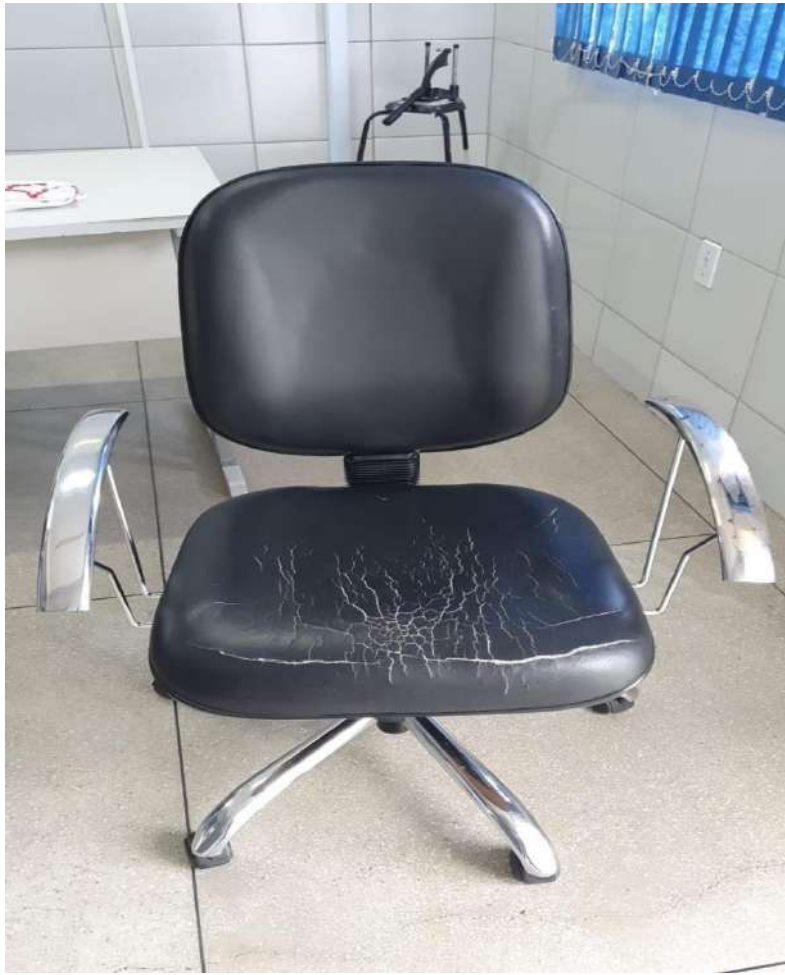
Tombo - 081895