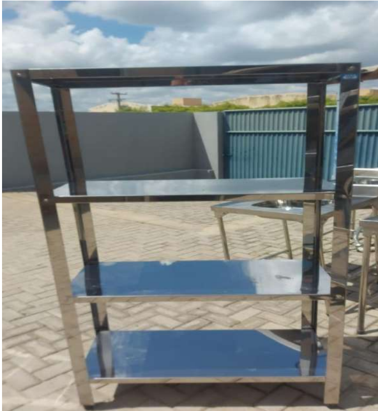
ESTANTE MADEIRA OU METALICA Estante em Aço, Lisa, 4 PlanosUS14. Tombo - 132820