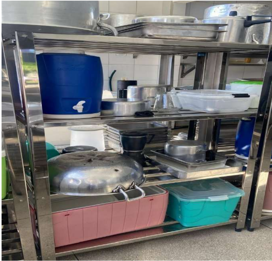
ESTANTE MADEIRA OU METALICA ESTATE EM ACO, PERFURADA, 4 PLANOSUSI15. Tombo - 132834