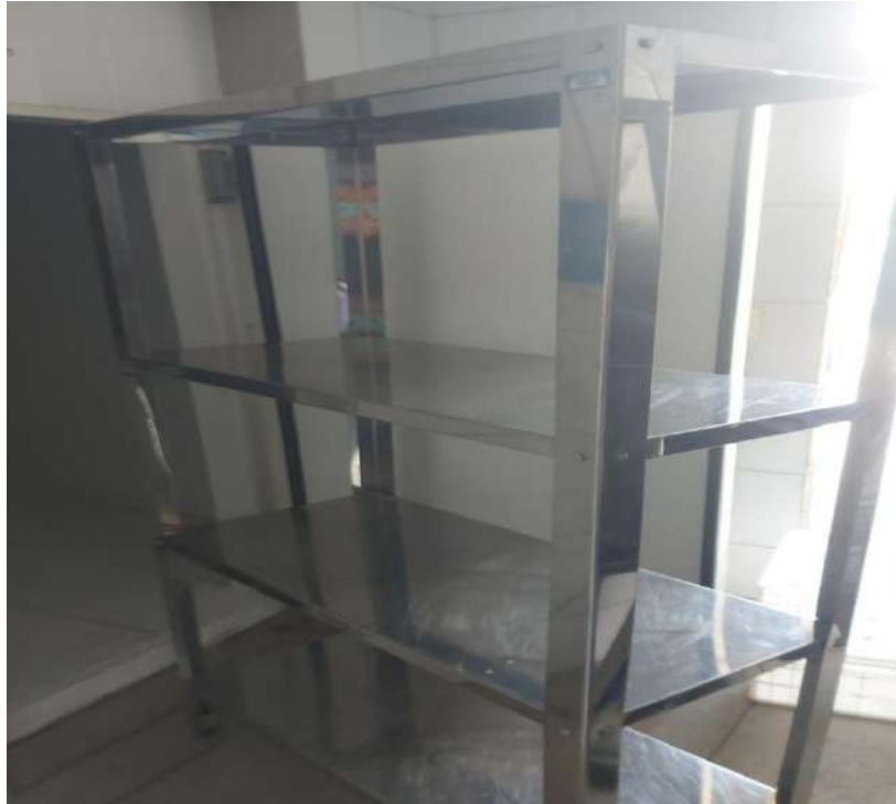
ESTANTE MADEIRA OU METALICA ESTANTE EM ACO, LISA, 4 PLANOSUS14. Tombo - 132817