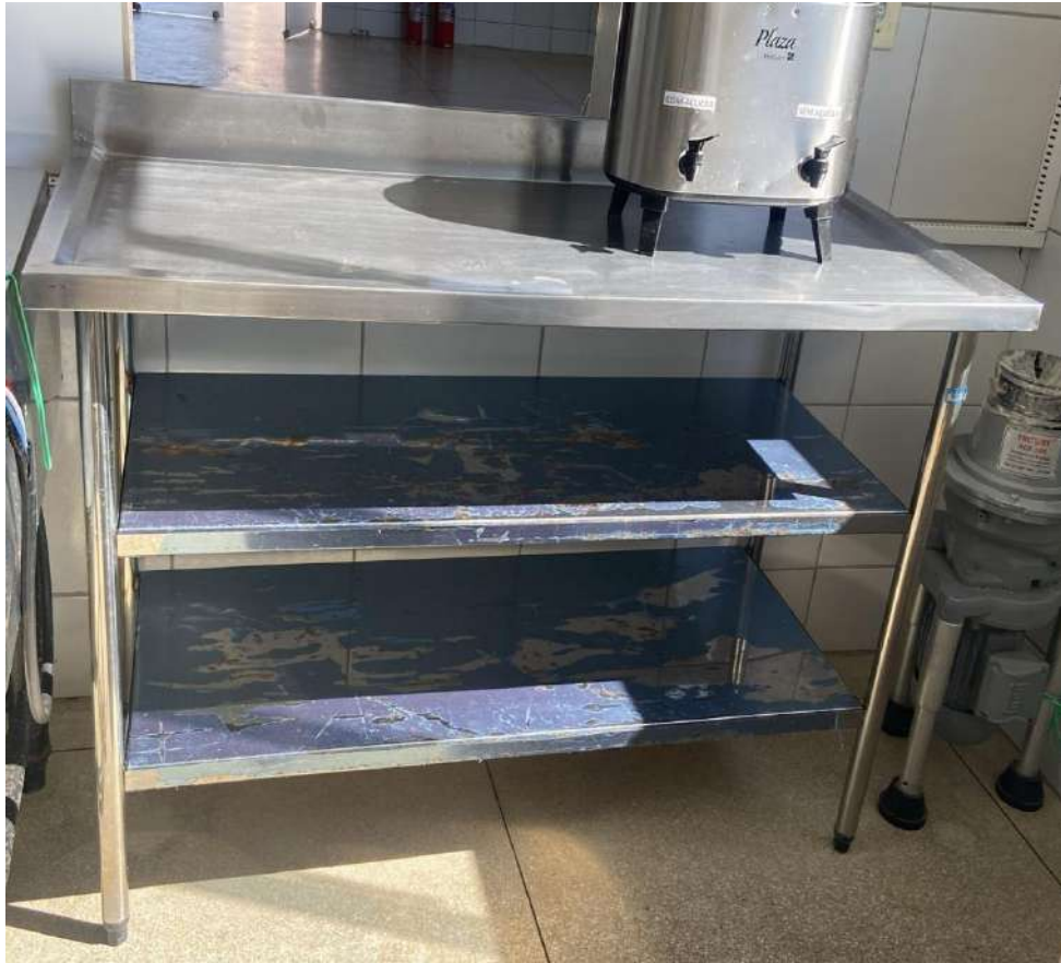
Tombo - 132945