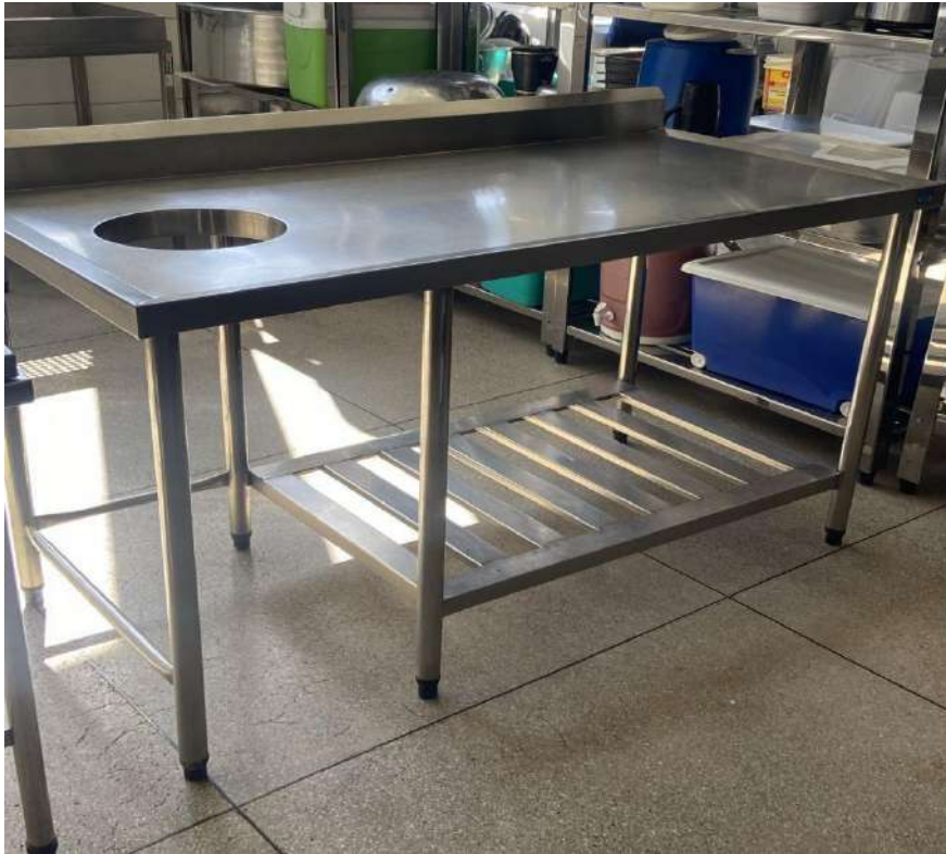
MESA EM ACO INOX COM FURO PARA TRITURADORGRUNOX. Tombo - 133410