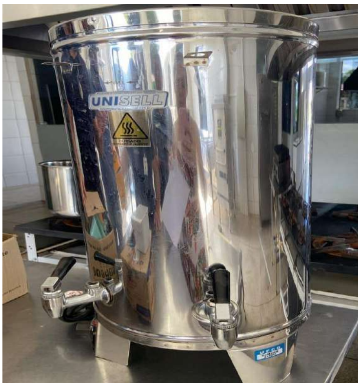
Tombo - 098906