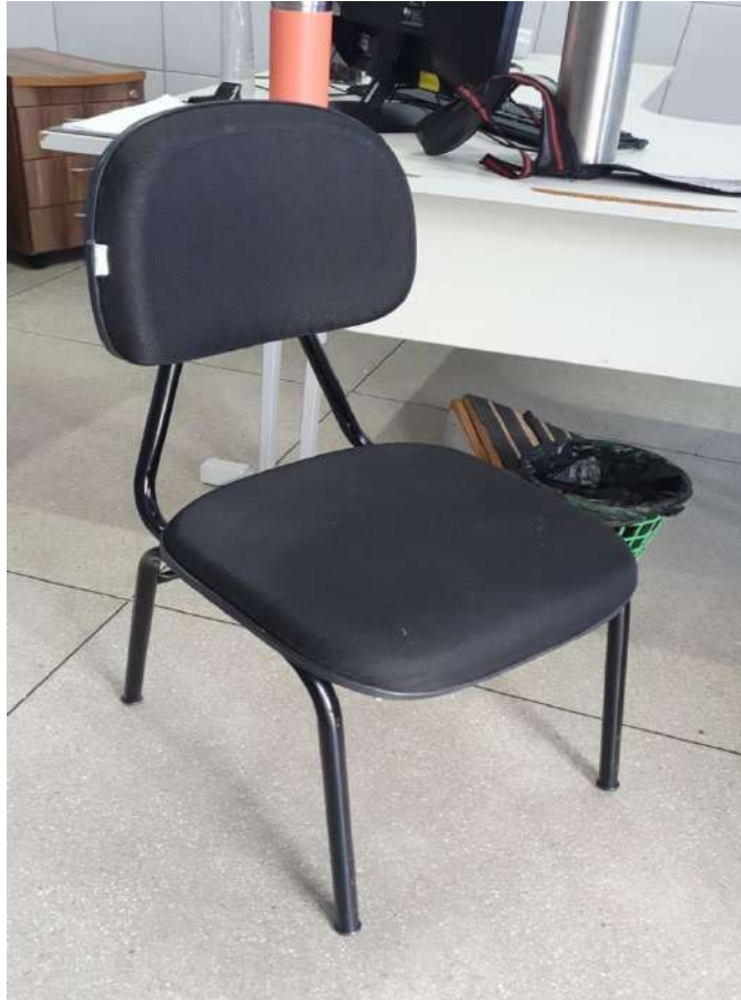
Tombo - 100468