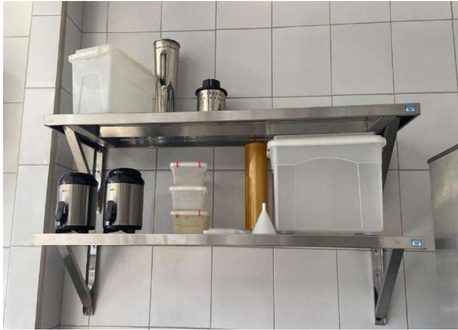
PRATELEIRAS MADEIRA OU METALICISA FABRICADA EM ACO INOX ARTFRIO. Tombos - 132844 e 132843