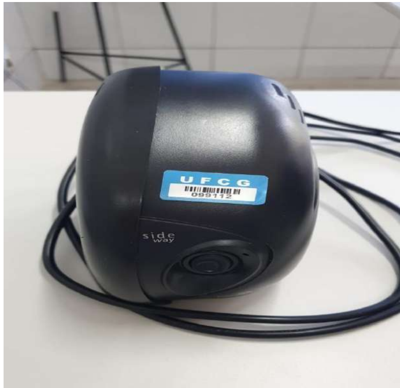
Tombo - 099112 (funciona)