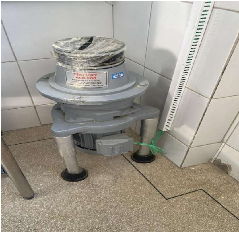
Tombo - 132685