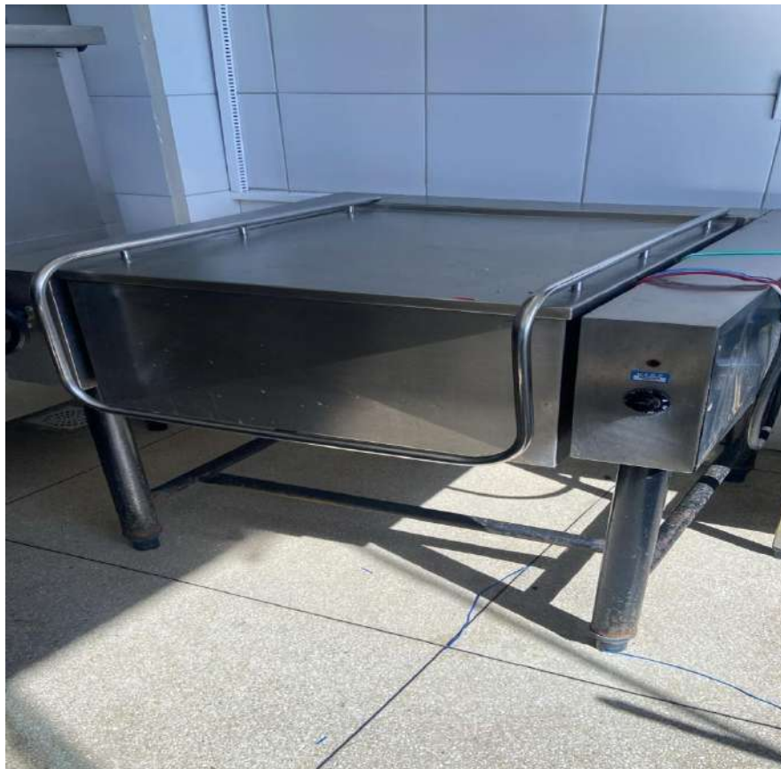
DIVERSOS USAVEIS EM COPA E COZINHA FRIGIDEIRA BASCULANTE ELETRICA 80L MOBINOX. Tombo - 133711 (não funciona)