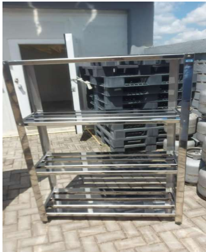
ESTANTE MADEIRA OU METALICA Estante em Aço, Perfurada, 4 PlanosUS15. Tombo - 132829