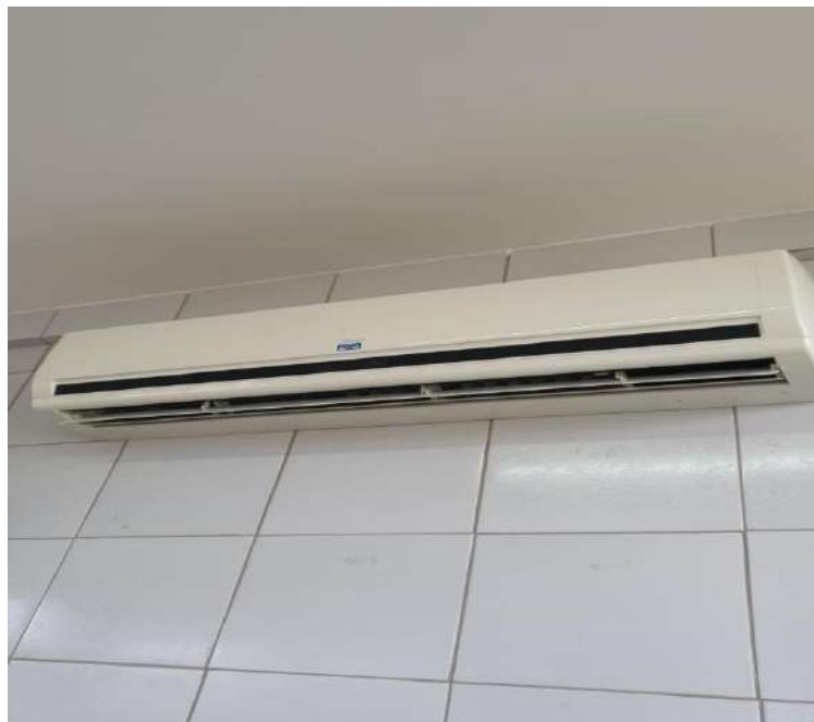
Tombo - 153291 (não funciona, precisa de manutenção)