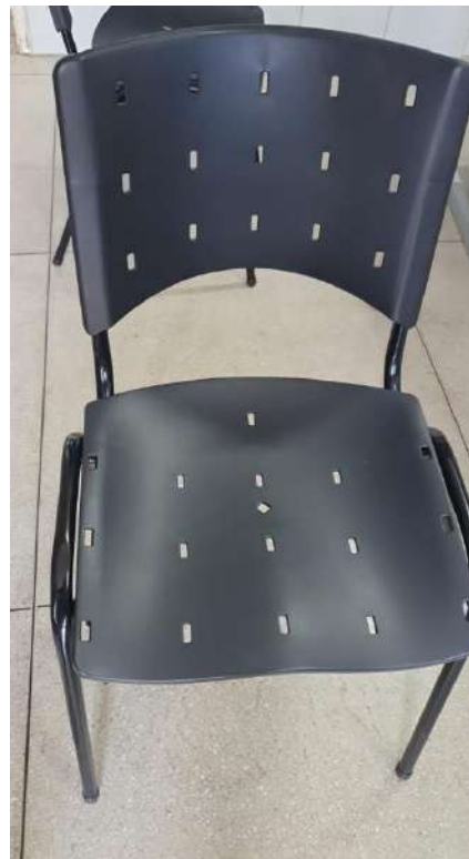
Tombo - 188310