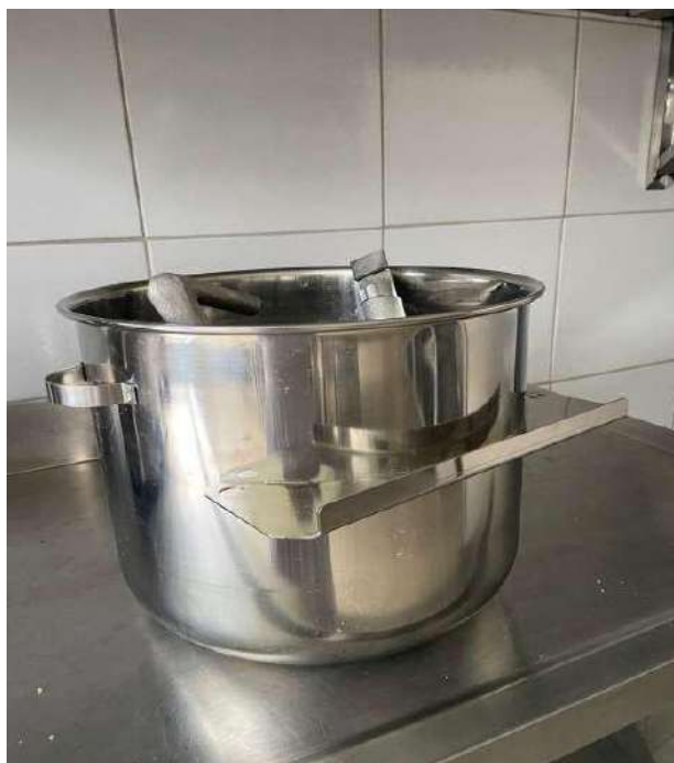
BATEDEIRA DE ALUMÍNIO 01 UNIDADE.