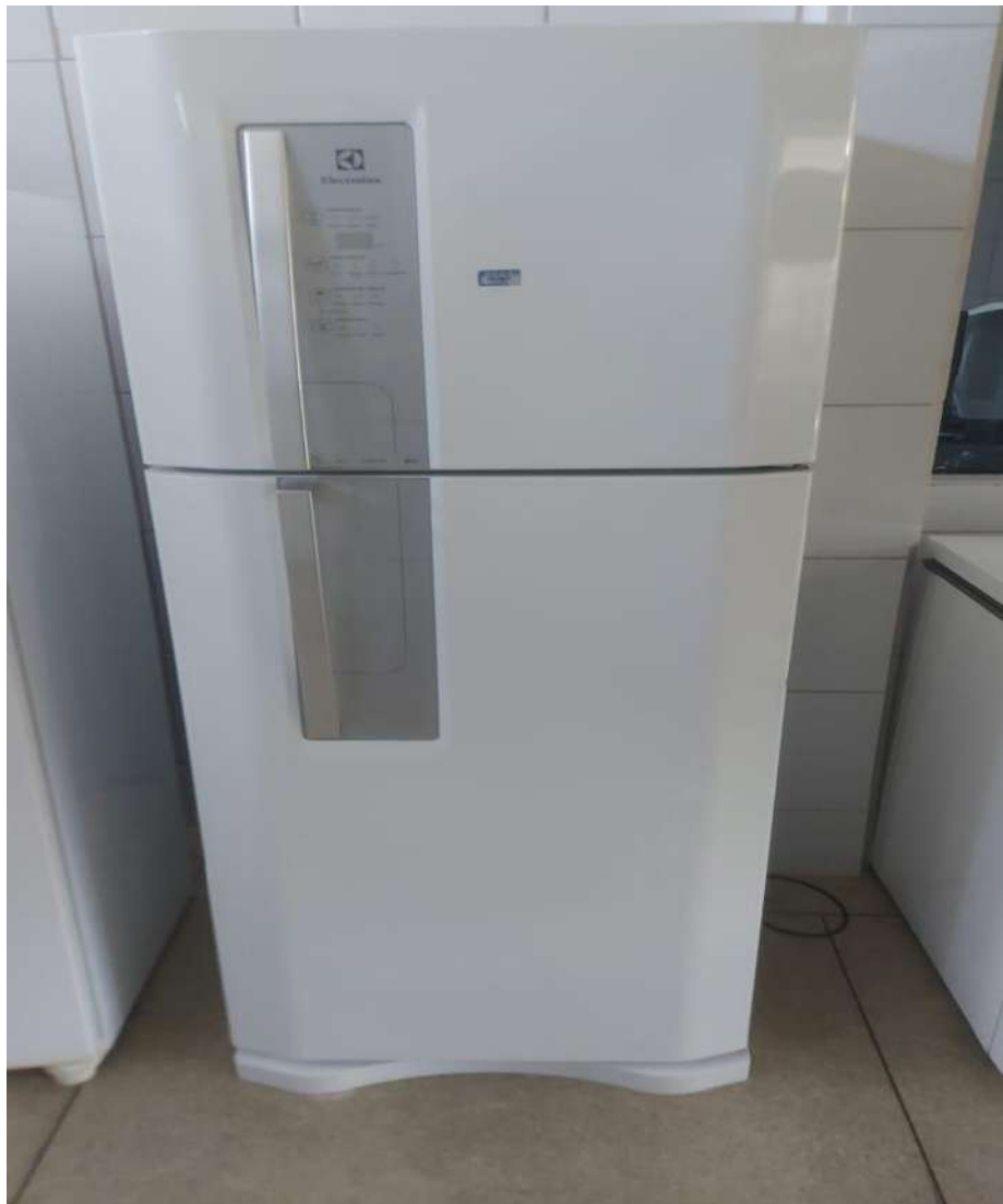
Geladeira Tombo - 133294 (funciona)