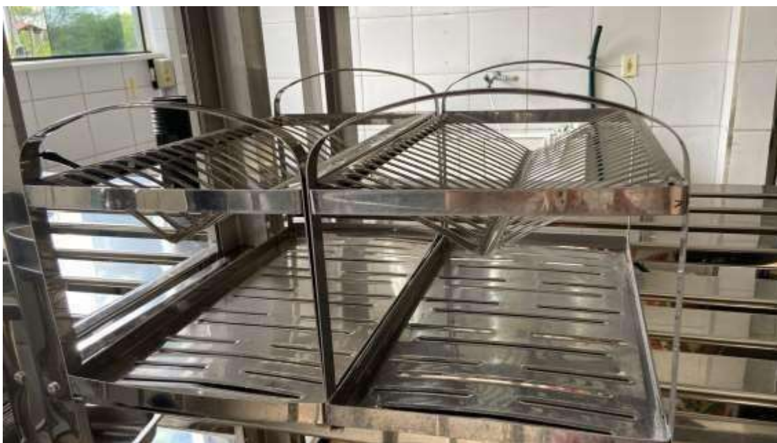
ESCORREDOR DE ALUMÍNIO, 02 UNIDADES.