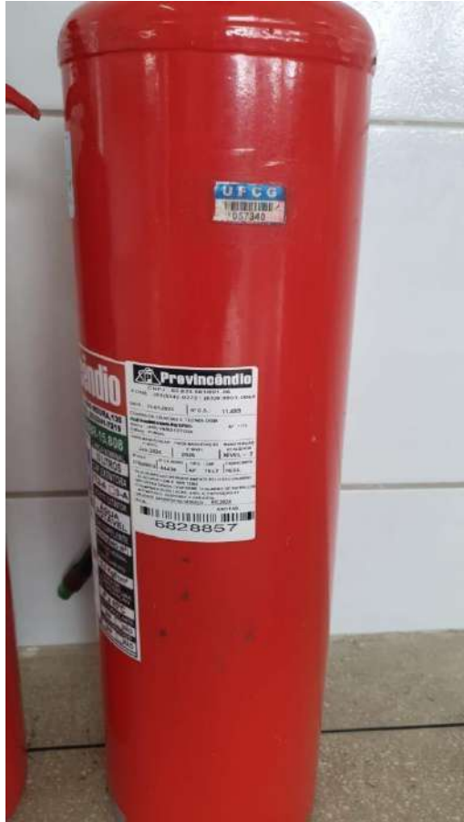
Tombo - 057340