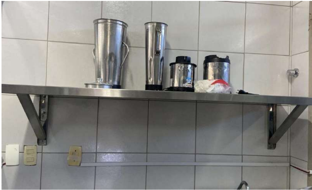
PRATELEIRA MADEIRA OU METALICALISA FABRICADA EM ACO INOX ARTFRIO. Tombo - 132842