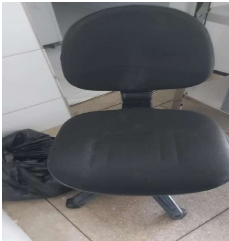
Tombo - 082623