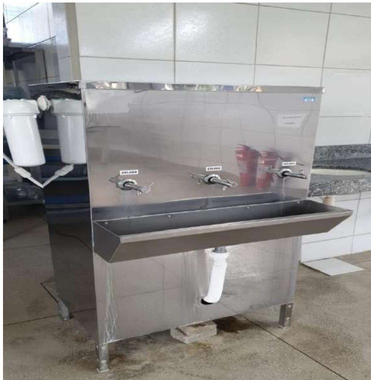
Tombo - 133645 (funciona)