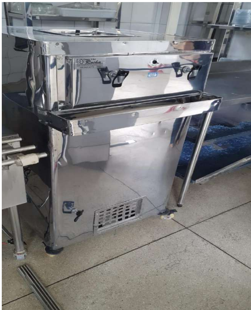
REFRESQUEIRAINOX MR. Tombo -133718 (precisa de manutenção)