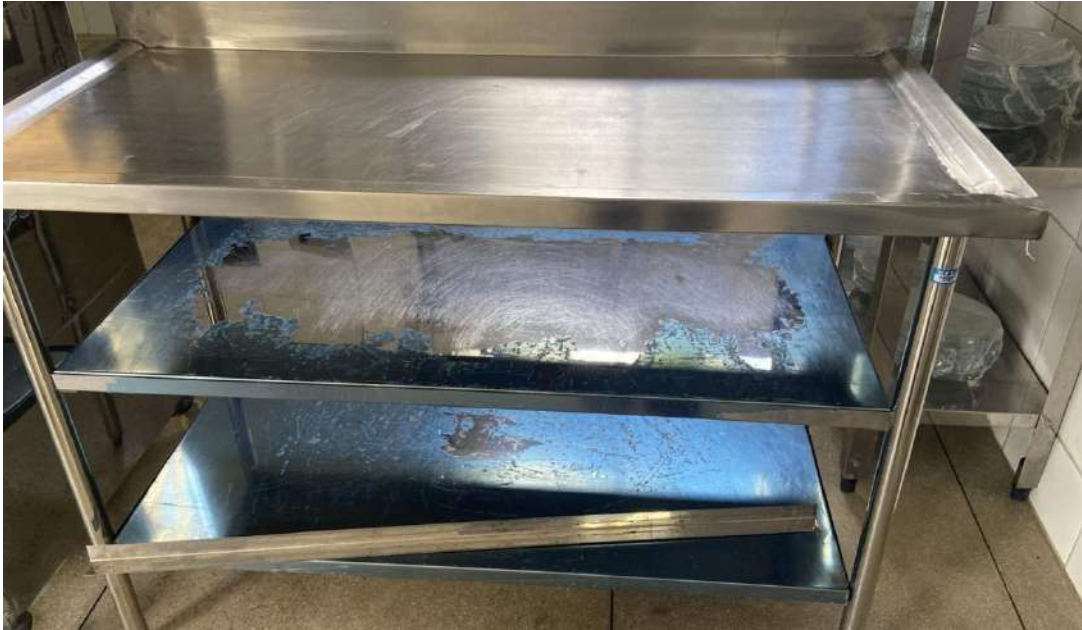
Tombo - 132942