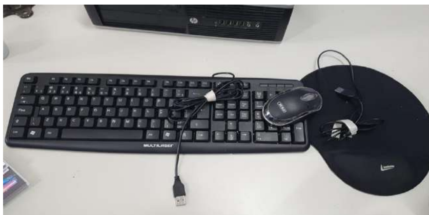
Sem tombo (consumo)