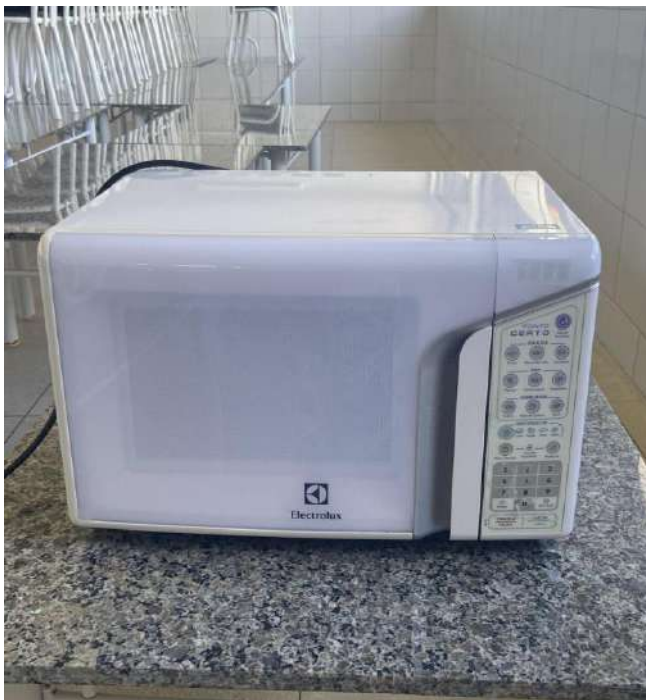
Micro-ondas Tombo – 132675 (funciona)