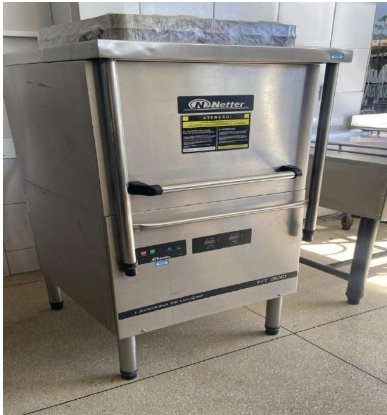
MESA PARA MAQUINA DE LAVAR LOUCAGRUNOX. Tombo – 133411 (não funciona)