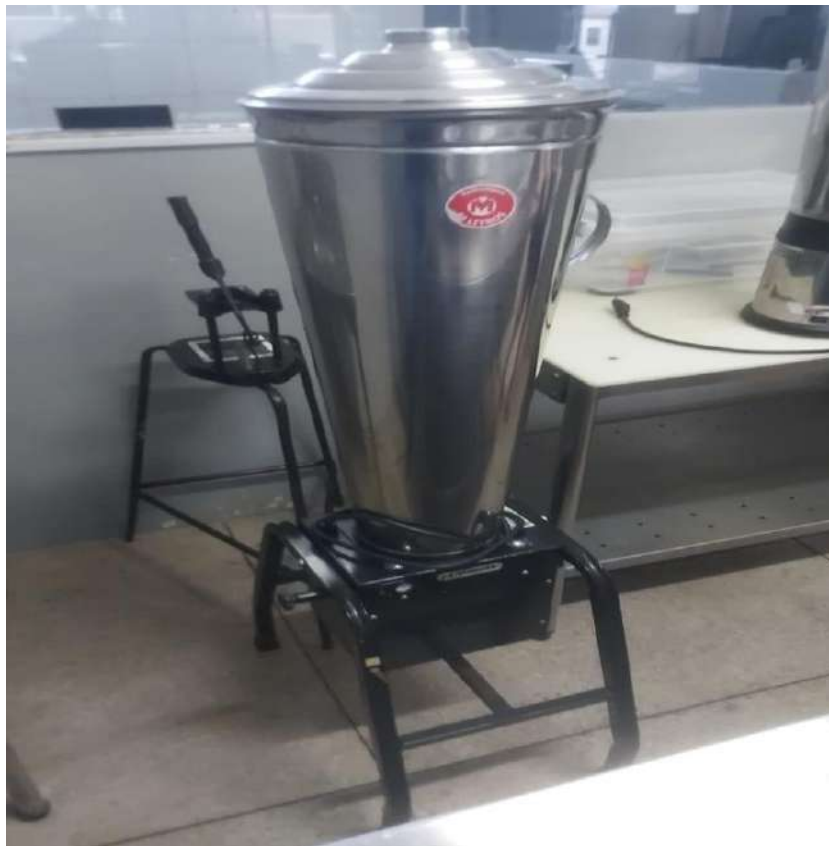
LIQUIDIFICADOR INDUSTRIALCOPO INOX 30 LITROS . Tombo - 180306 (funciona)