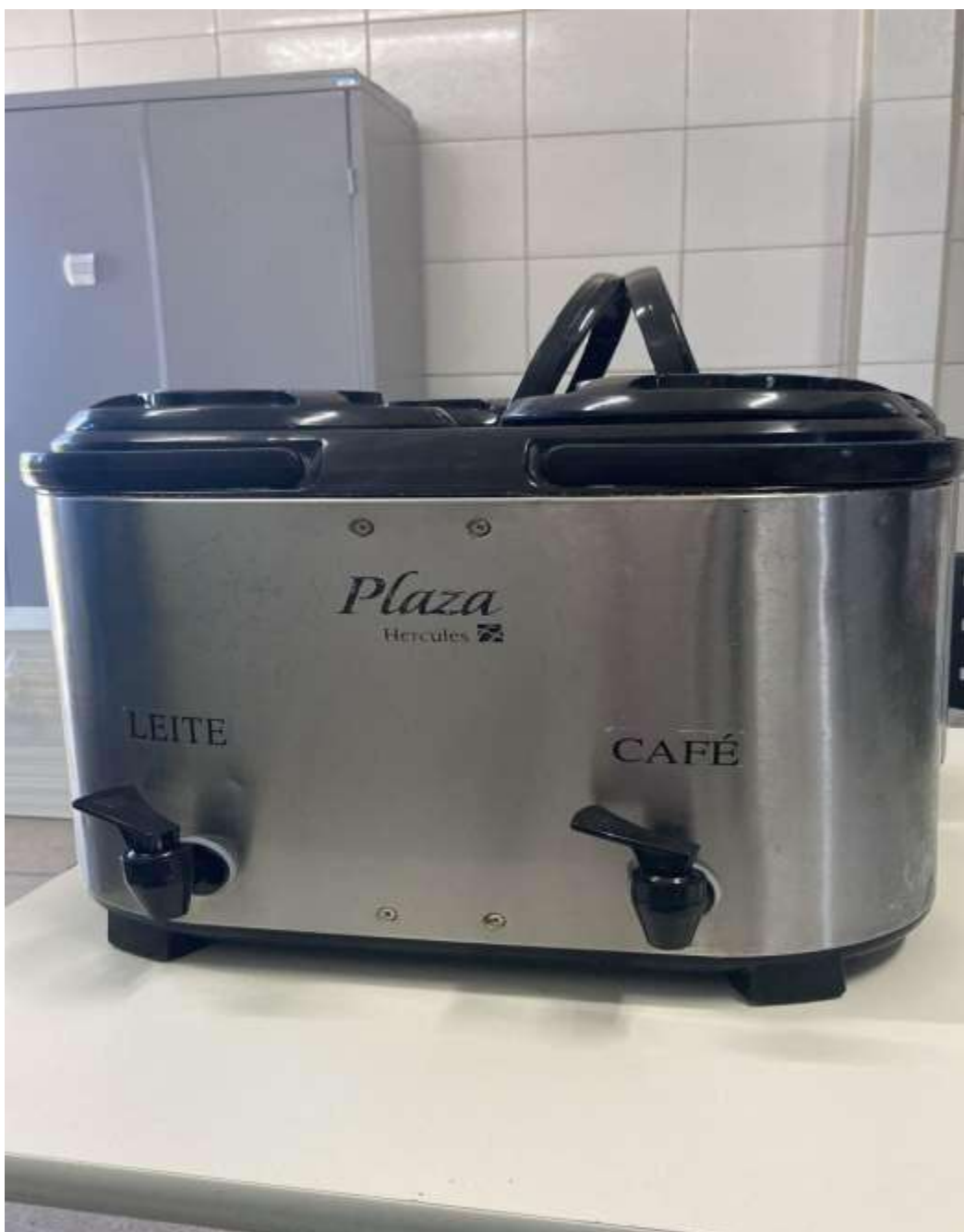
GARRAFA DE CAFÉ E LEITE TÉRMICA 02 UNIDADE (só esquentar 01).