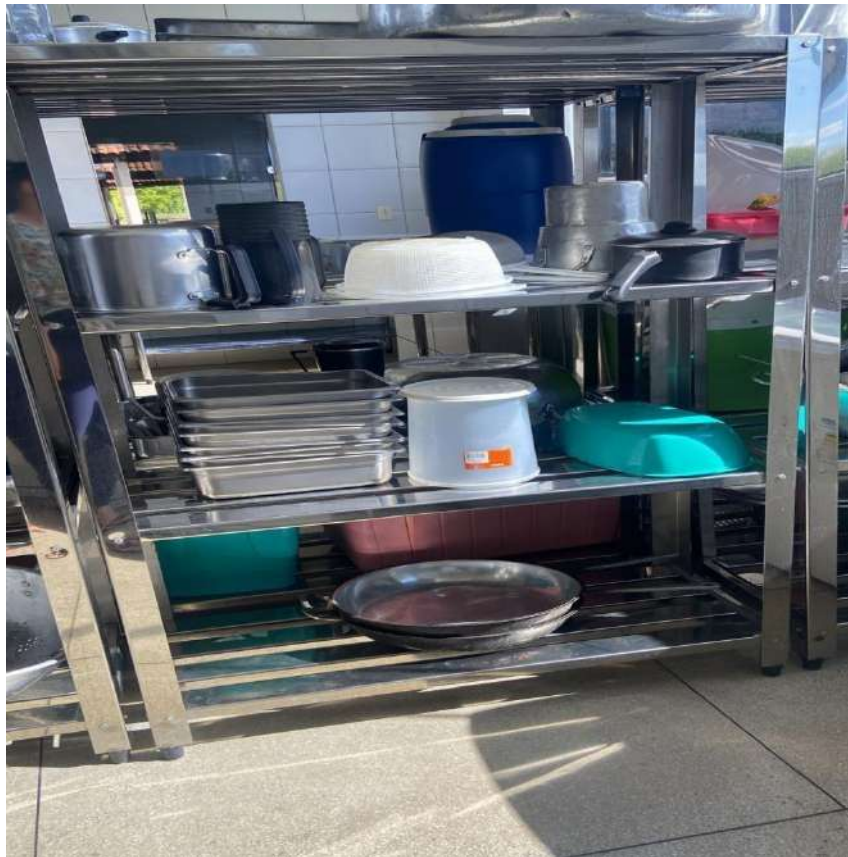
ESTANTE MADEIRA OU METALICA ESTANTE EM ACO, PERFURADA, 4 PLANOSUSI15. Tombo - 132828