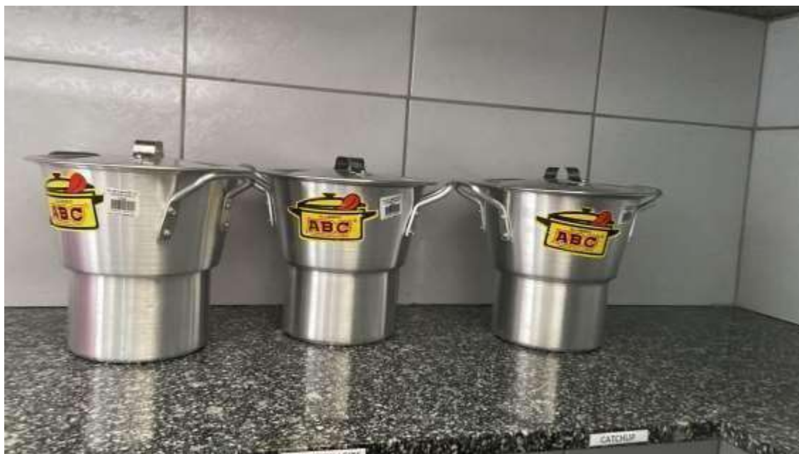
CUSCUZEIRAS ABC 03 UNIDADES