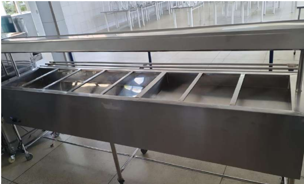
BALCAO TERMICO BUFFET TERMICO P/ 10GNSOLUTION. Tombo - 133715 (funciona a parte quente, não funciona a parte gelada)