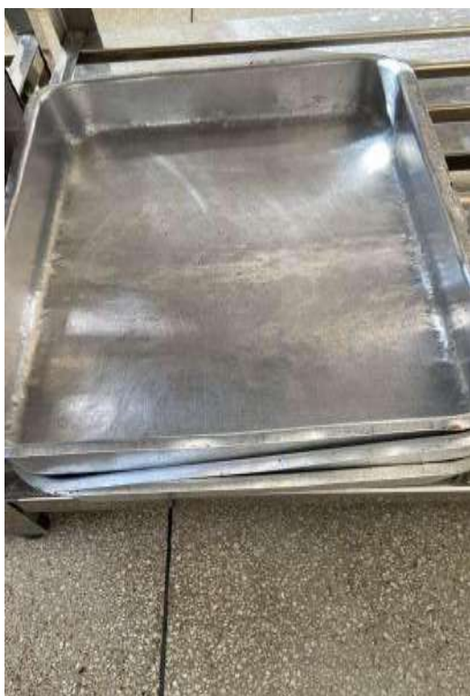
FORMAS GRANDES 03 UNIDADES