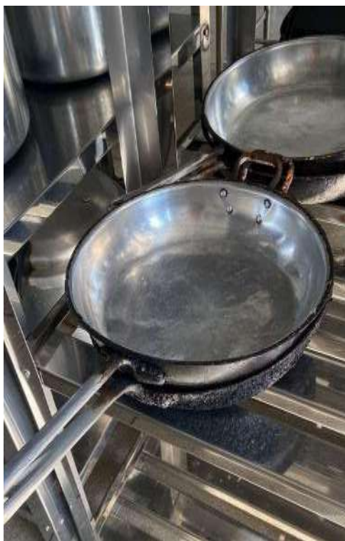
FRIGIDEIRAS 04 UNIDADES