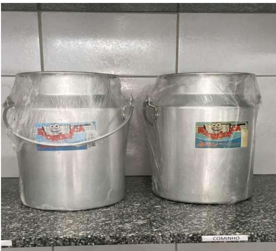
LEITERAS 03 UNIDADES.