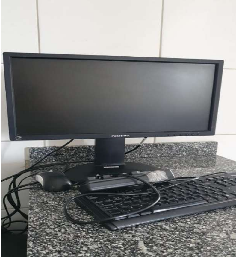
Tombo – 087234 (funciona)