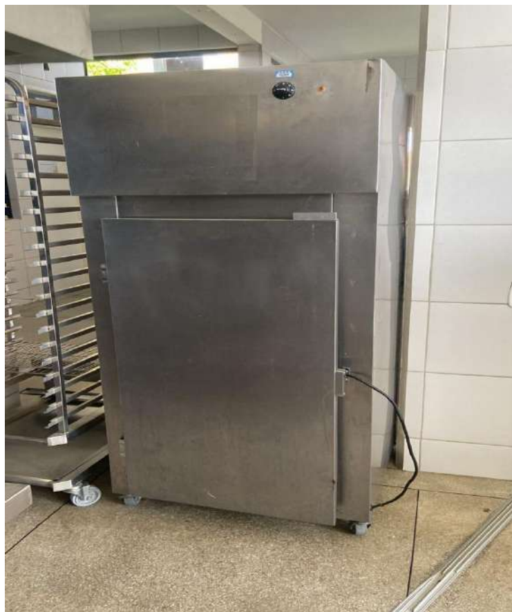
ESTUFA VERTICAL TIPO PASS THROUGH SOLUTION. Tombo - 133713 (funciona)