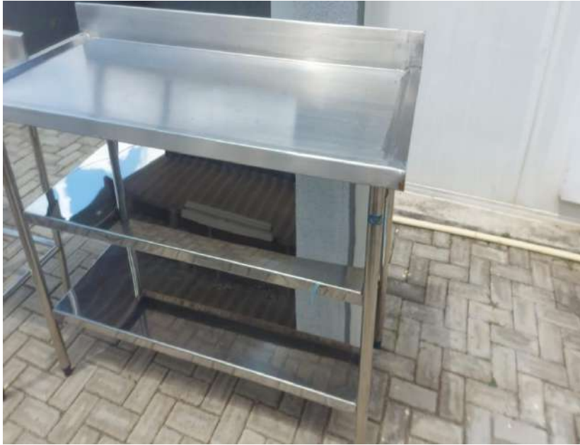
Tombo - 132943