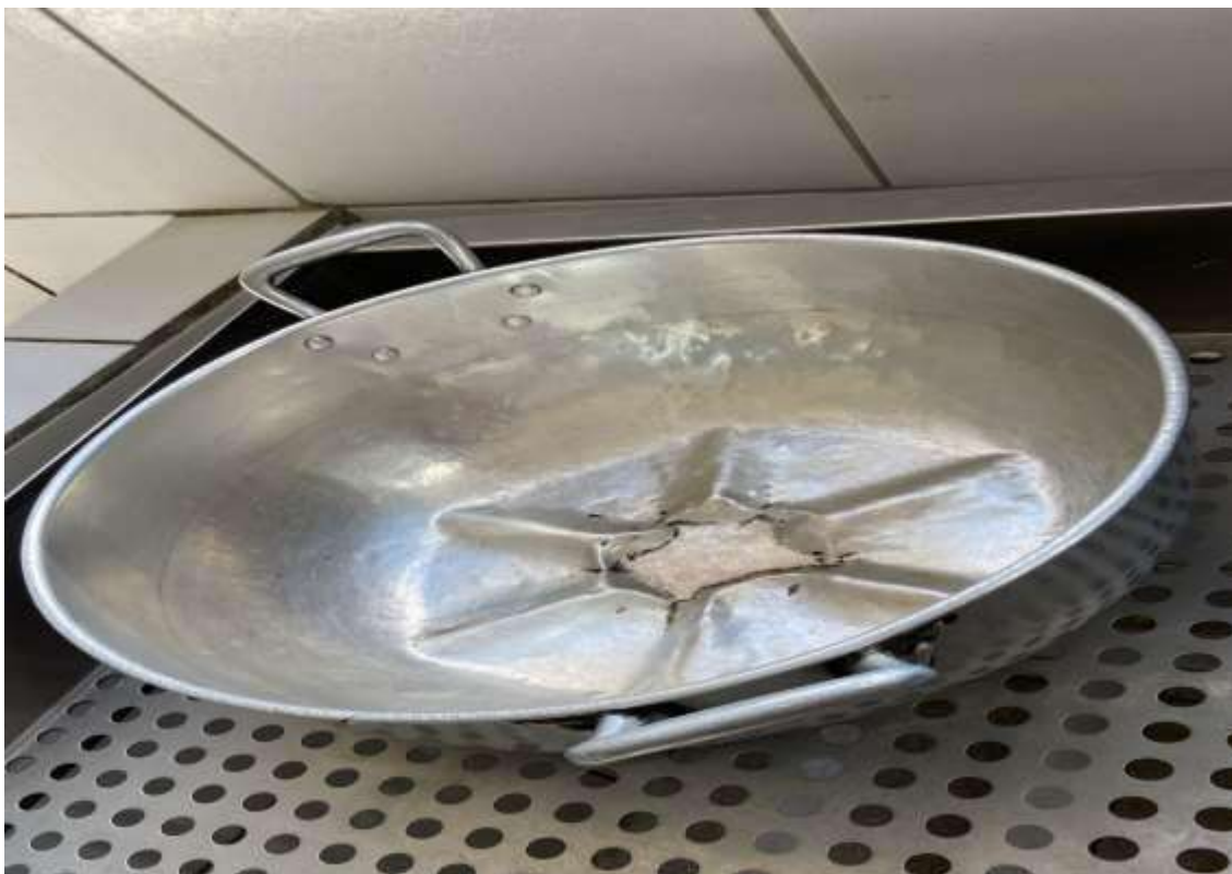
TACHO PEQUENO 01 UNIDADE