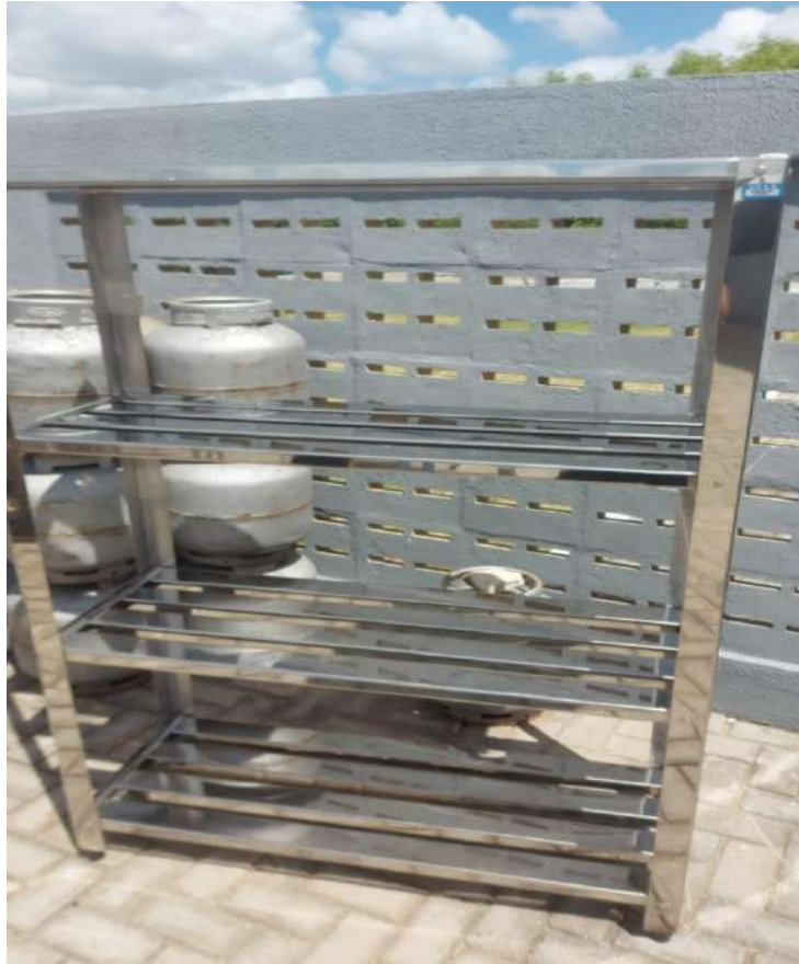
ESTANTE MADEIRA OU METALICA Estante em Aço, Perfurada, 4 PlanosUS15. Tombo - 132831