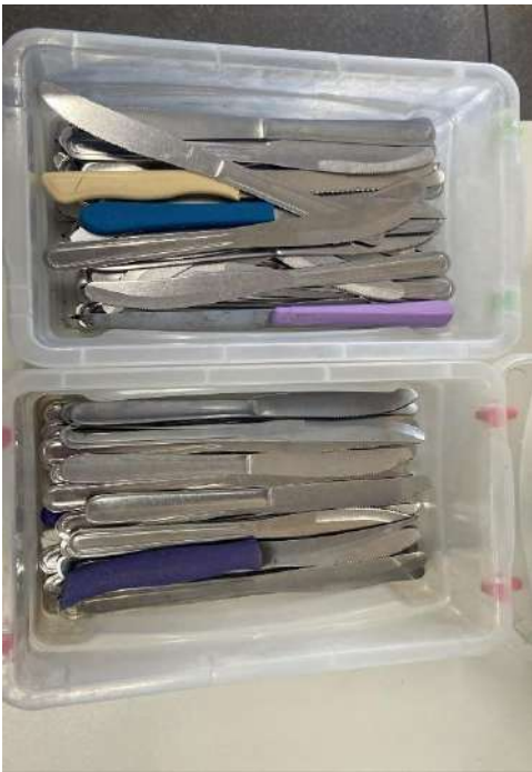
FACAS 100 UNIDADES