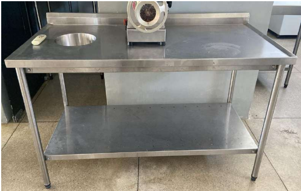
Mesa de alumínio - Sem tombo