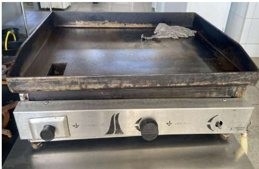
Sem tombo (funciona, mas precisa de manutenção)