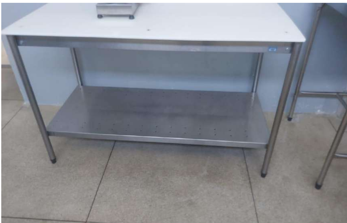
MESA AUXILIAR P/COZINHA EM ACO INOX C/ TAMPO EM POLIETILENOARTFRIO. Tombo - 132848