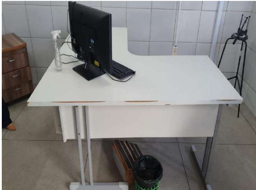
Mesa de escritório Tombo - 038301