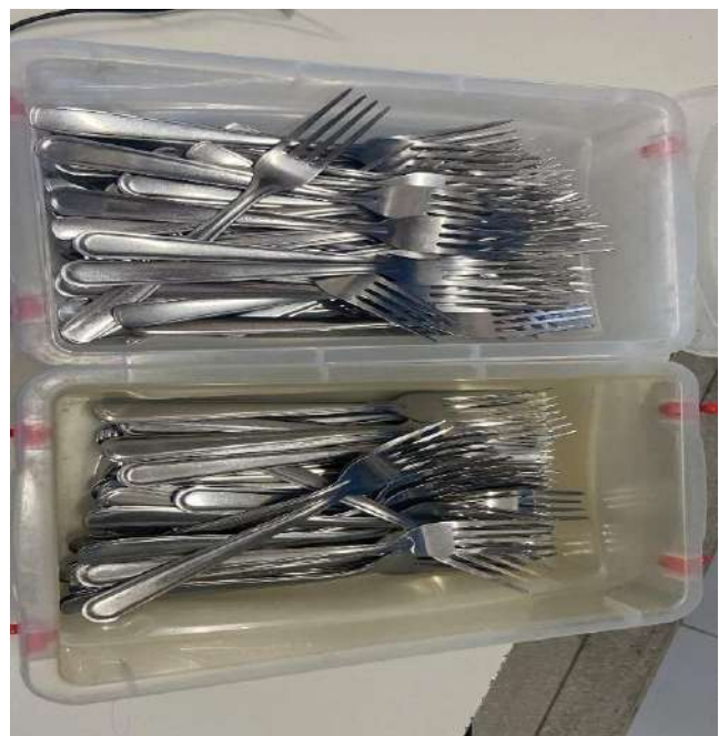
GARFOS 80 UNIDADES