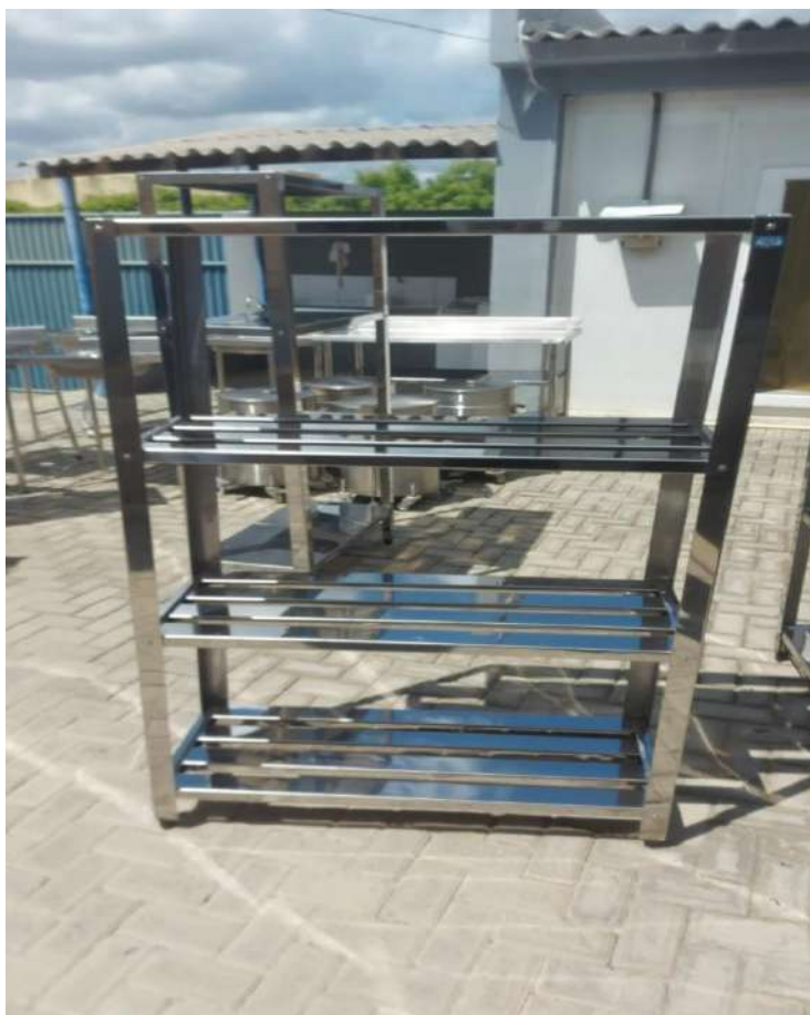
ESTANTE MADEIRA OU METALICA Estante em Aço, Perfurada, 4 Planos SUS15. Tombo - 132827