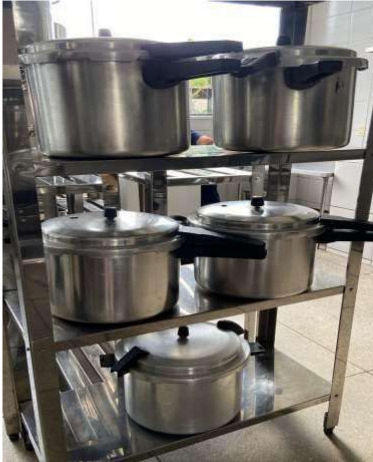
PANELA DE PRESSÃO 20 L, 5 UNIDADES.