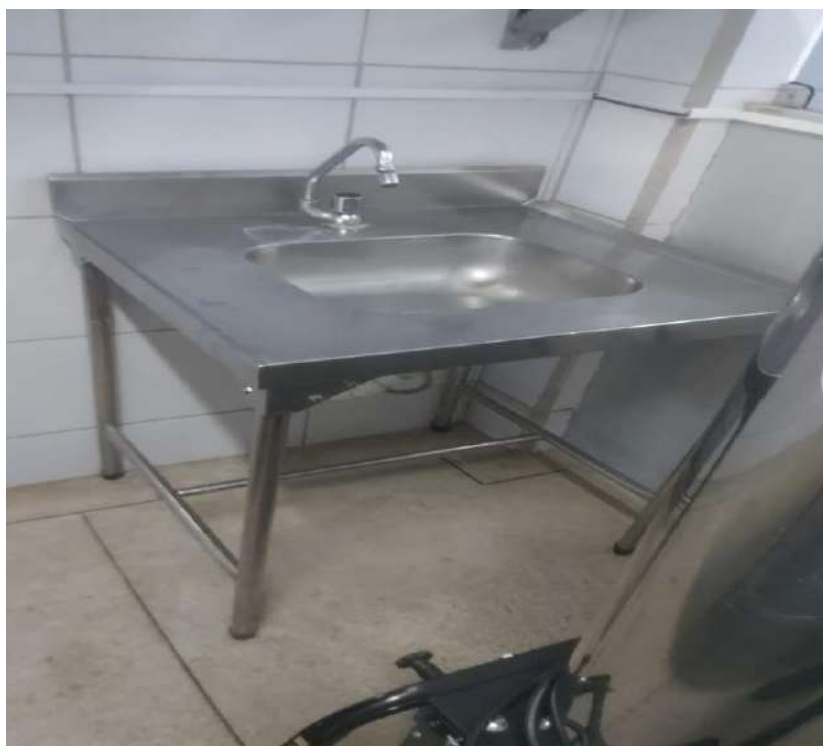
Pia de lavar mãos-Sem tombo