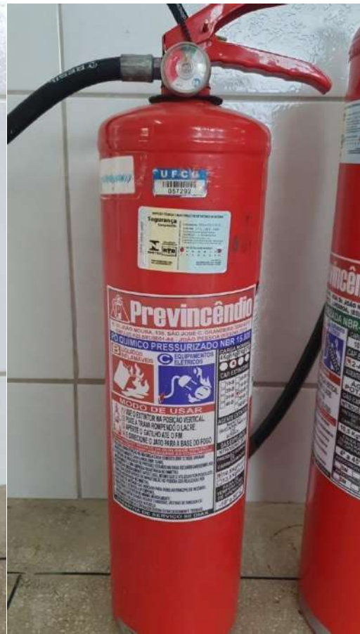
Tombo - 057292