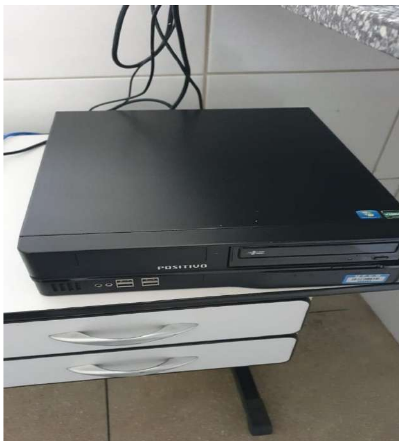
Gabinete Tombo - 086489 (funciona)