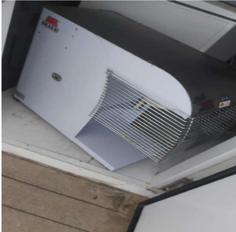
BATEDEIRA INDUSTRIALPLANETARIA BRAESI. Tombo – 100802 (funciona)