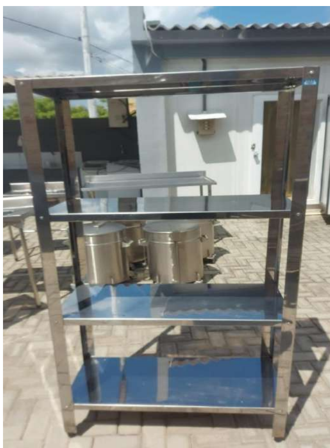
ESTANTE MADEIRA OU METALICA ESTATE EM ACO, LISA, 4 PLANOSUSI14. Tombo -132824