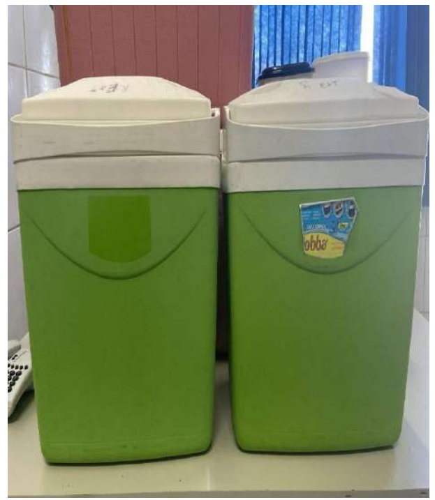
CAIXAS TÉRMICAS VERDES 02 UNIDADES