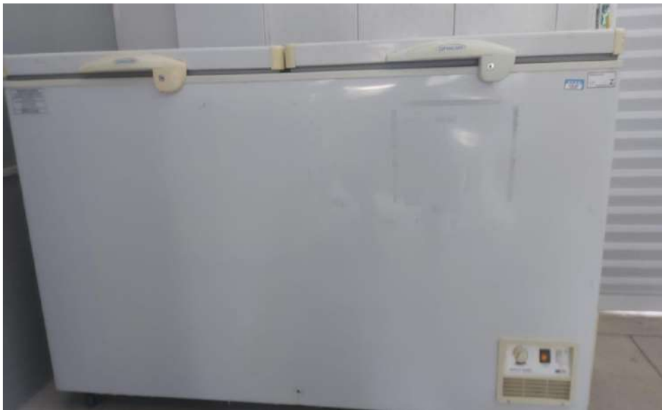
FREEZER HORIZONTAL Tombo - 099506 (funciona)