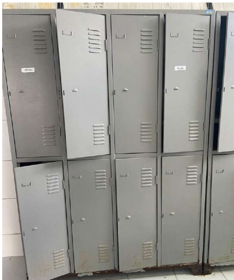
Tombo - 132939 (com ferrugem)