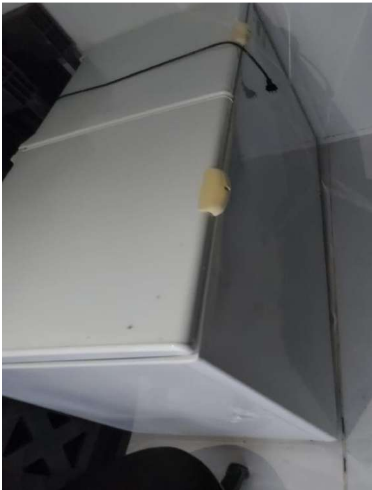
FREEZER HORIZONTAL, BRANCOMETALFRIO. Tombo - 132428