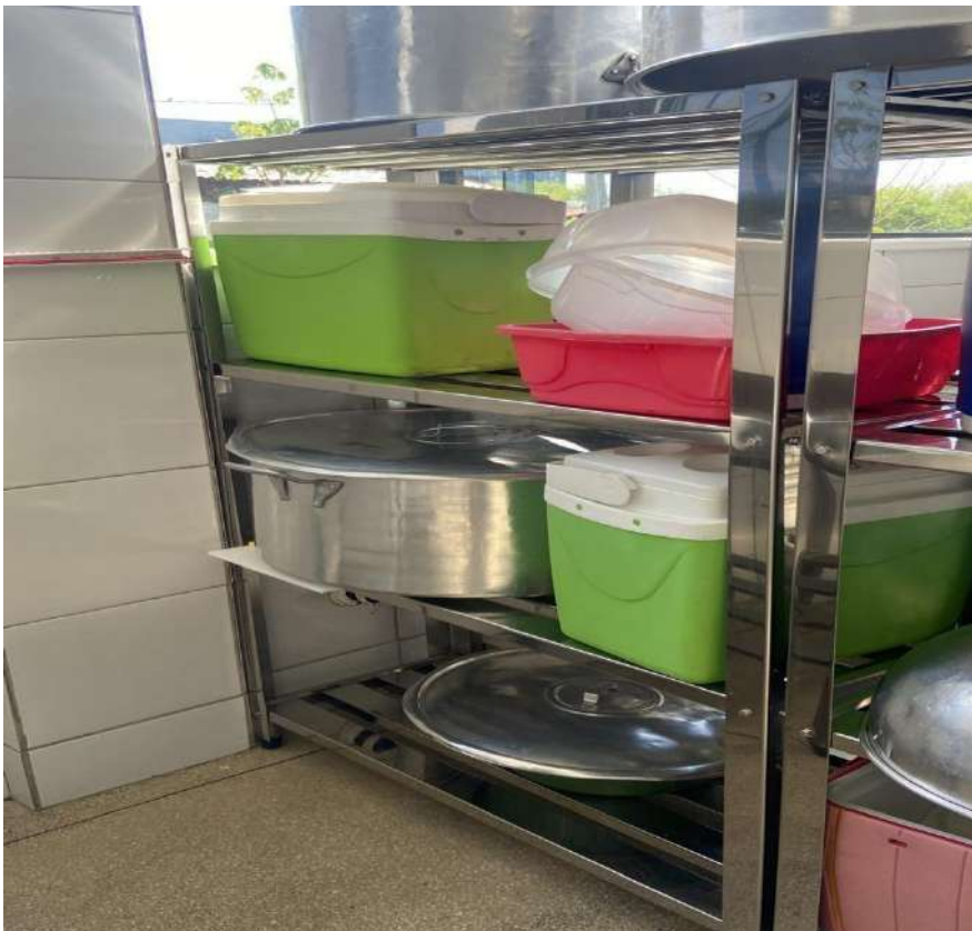
ESTANTE MADEIRA OU METALICA ESTATE EM ACO, PERFURADA, 4 PLANOSUSI15. Tombo - 132836