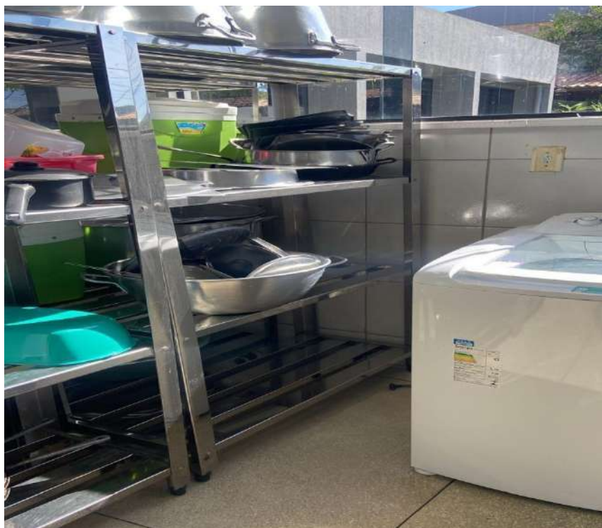
ESTANTE MADEIRA OU METALICA ESTANTE EM ACO, PERFURADA, 4 PLANOSUSI15. Tombo - 132835