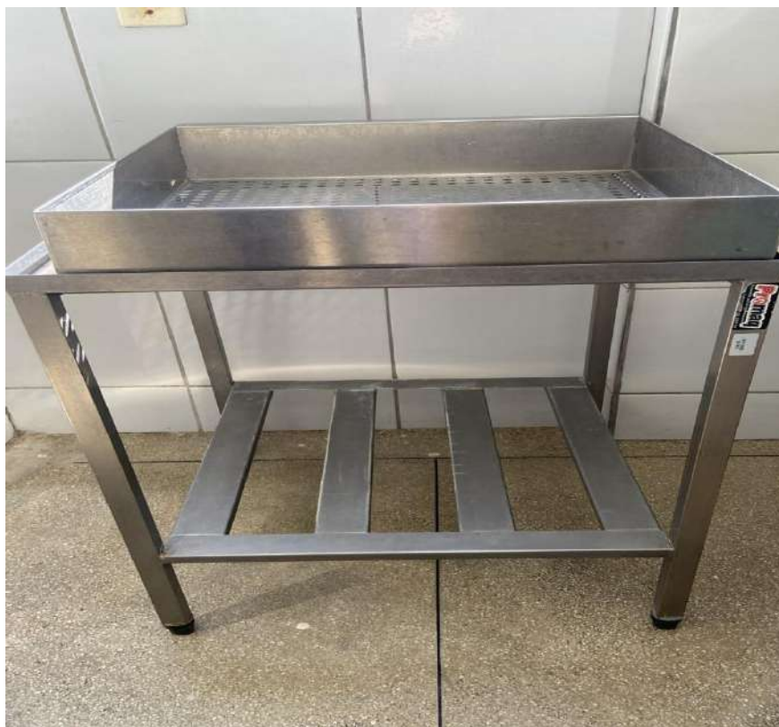
MESA AUXILIAR P/COZINHA MÓVEL PARA MÁQUINA DE LAVAR LOUCASOLUTION. Tombo - 132933