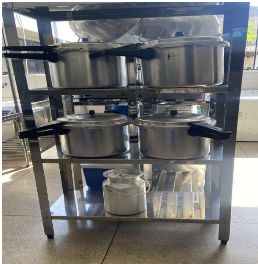
Estante Tombo - 132819