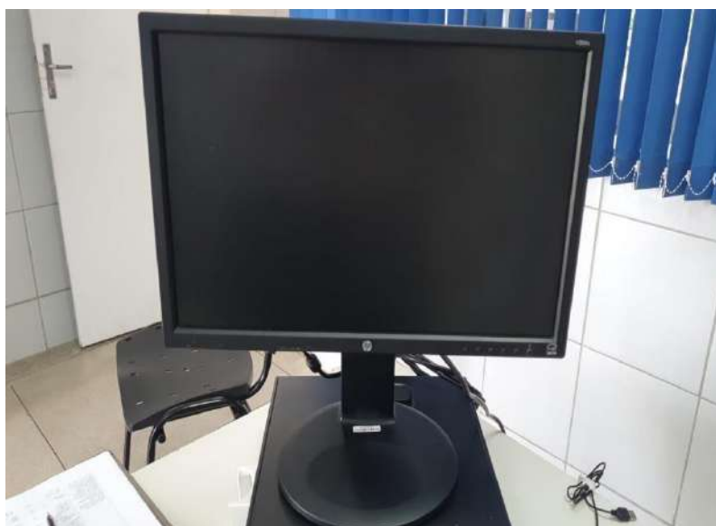
Monitor Tombo – 121747 (funciona)