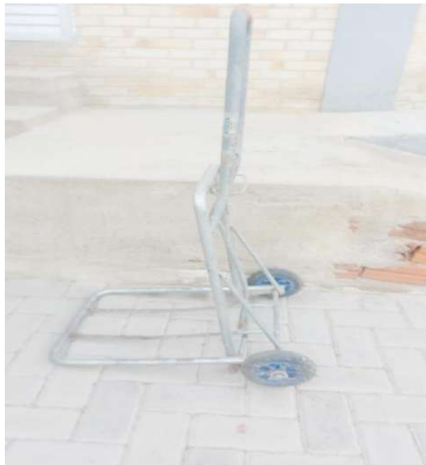
Tombo - 057937