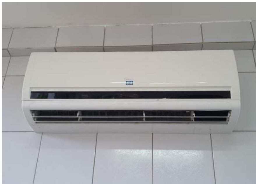
Tombo – 153290 (não funciona, precisa de manutenção)