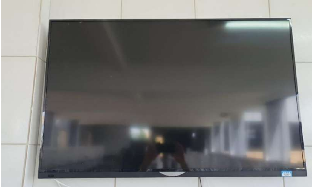
TELEVISOR LCD, 46 POLEGADASAOC. Tombo – 100732 (funciona)