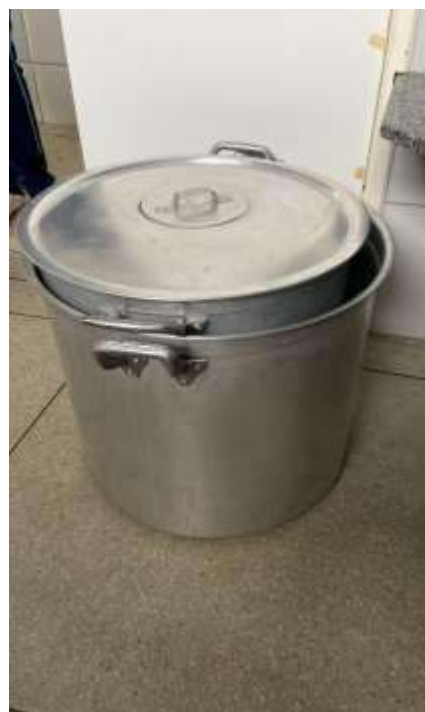
CALDEIRÕES, 07 UNIDADES