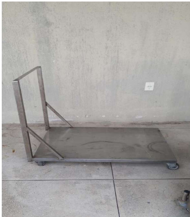
CARRO PLATAFORMA INOX, CAPACIDADE 200KGSOLUTION. Tombo - 132932