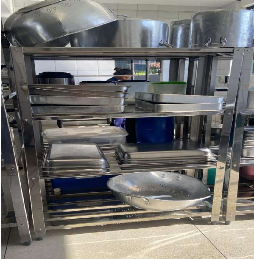
ESTANTE MADEIRA OU METALICA ESTANTE EM ACO, PERFURADA, 4 PLANOSUSI15. Tombo - 132833