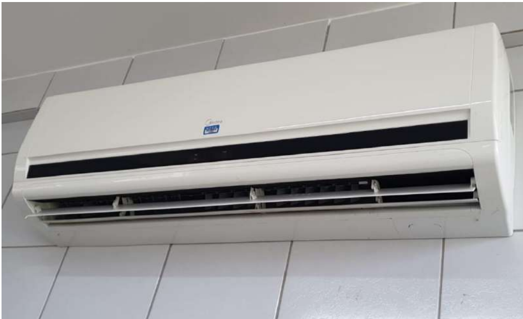
Tombo - 153291 (manutenção)