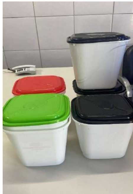
DEPÓSITO PLÁSTICO 07 UNIDADES