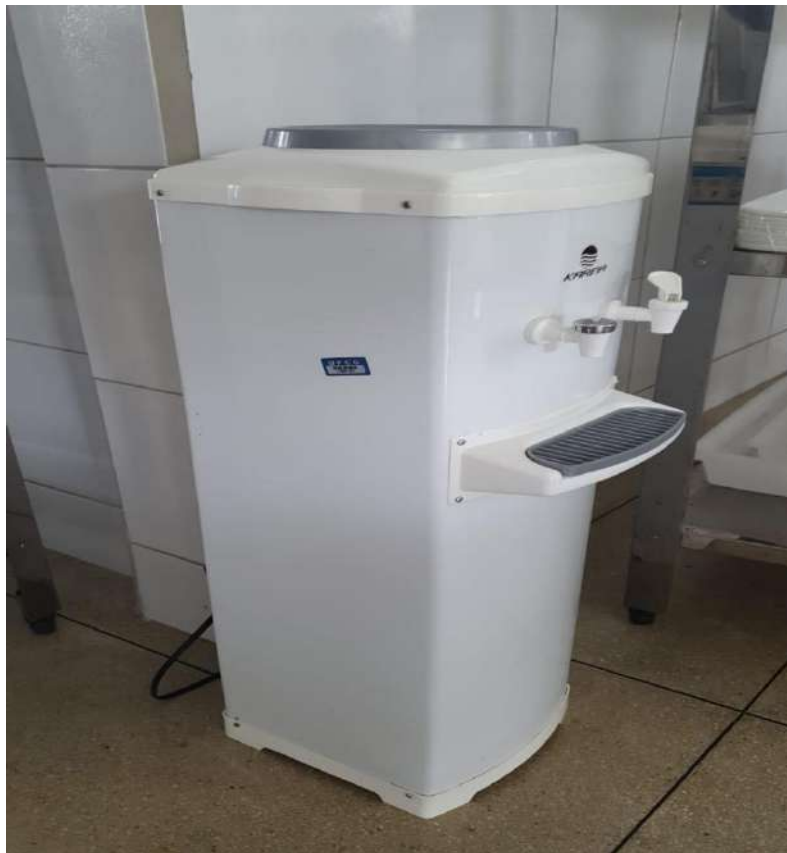
Tombo - 146127 (funciona)