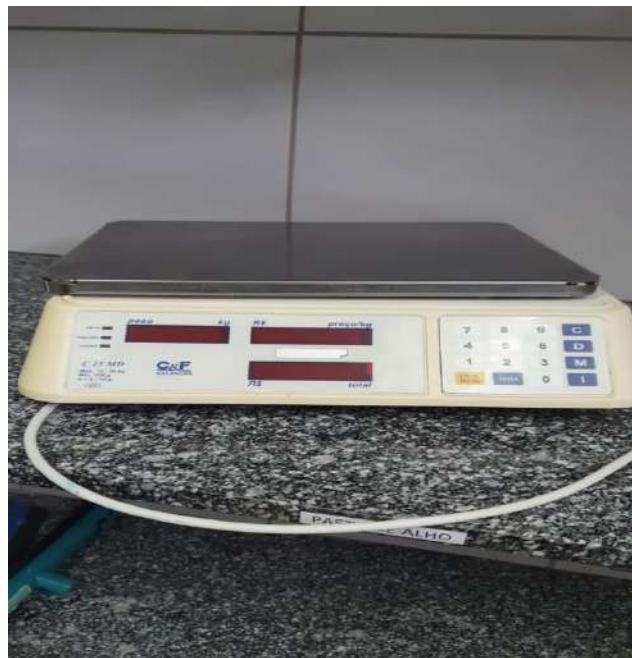
Tombo - 058078 (funciona)