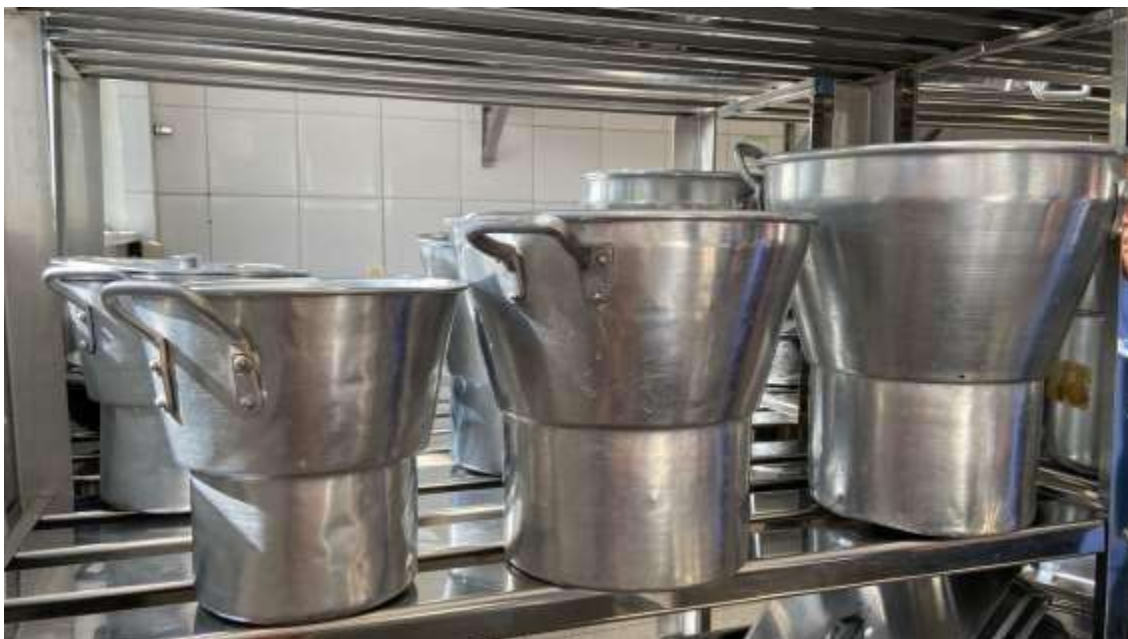
CUSCUZEIRAS 06 UNIDADES