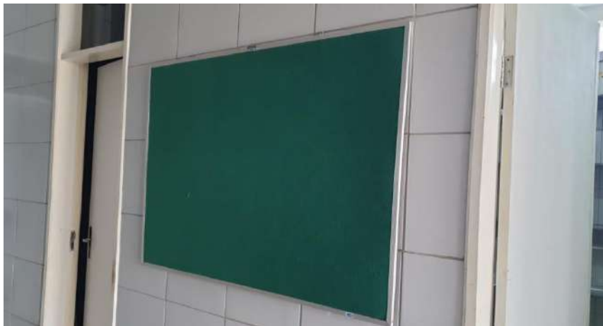
Tombo - 098880