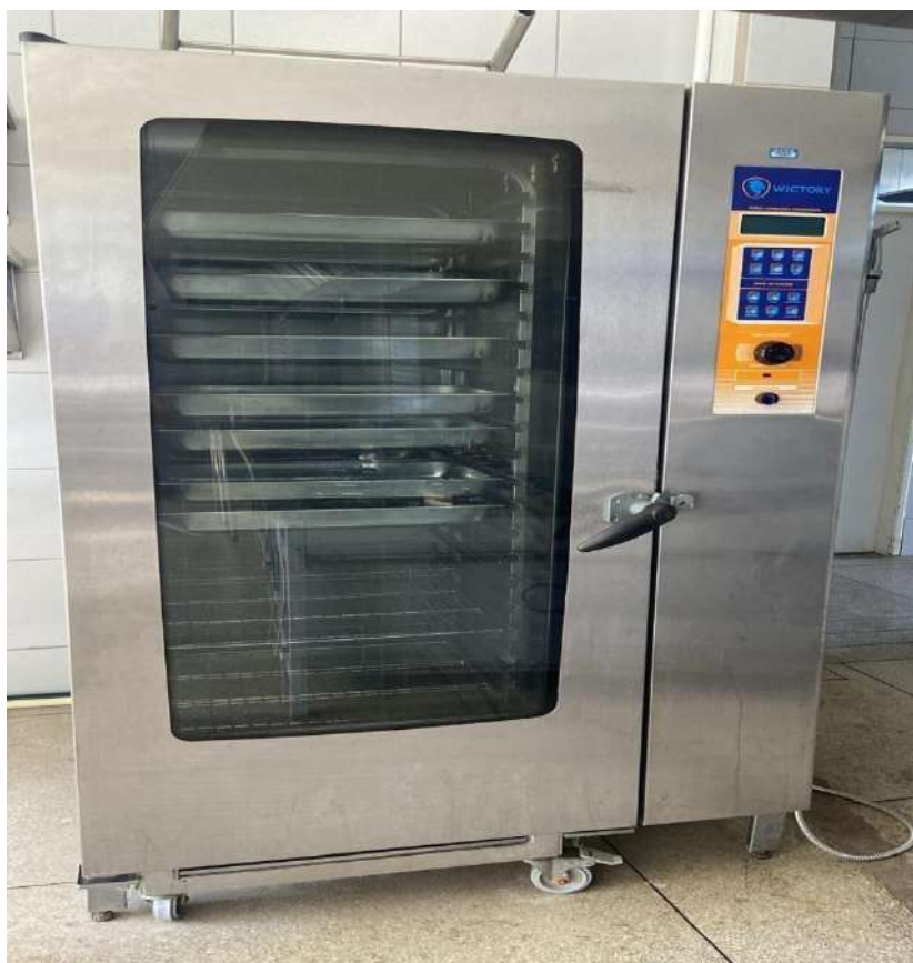
FORNO INDUSTRIAL FORNO COMBINADO A GASWICTORY/LTEDESCO. Tombo – 133417 (não funciona, instalação do gás errada)