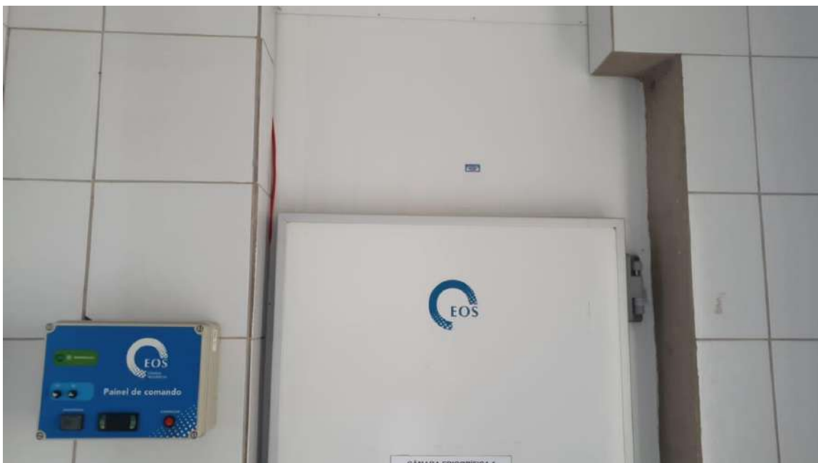
CAMARA DE RESFRIAMENTO HENRINOX. Tombo – 133649 (funciona)