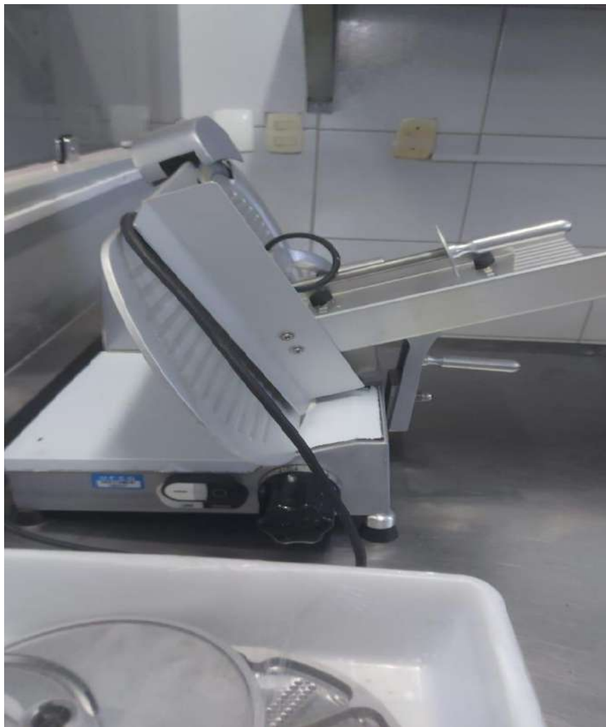
CORTADOR DE FRIOSAUTOMATICO SIRMAN. Tombo - 180317