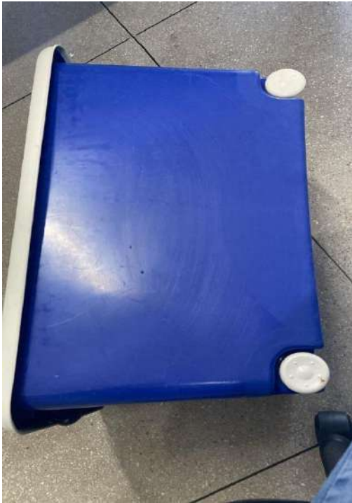
CAIXA DE PLÁSTICO ORGANIZADORA AZUL 01 UNIDADE