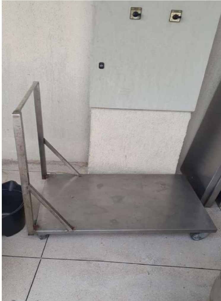
CARRO PLATAFORMA INOX, CAPACIDADE 200KGSOLUTION. Tombo - 132931