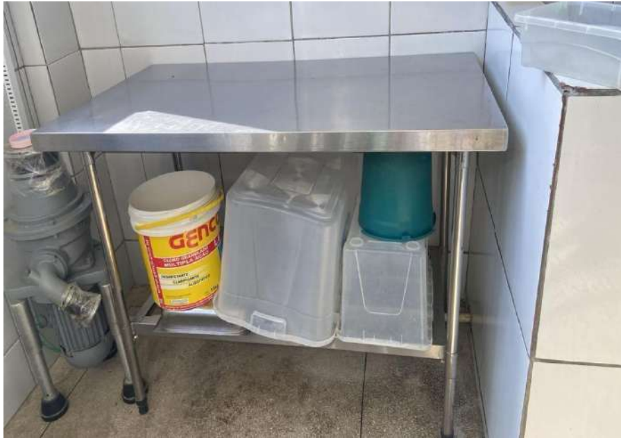
Mesa de alumínio - Sem tombo