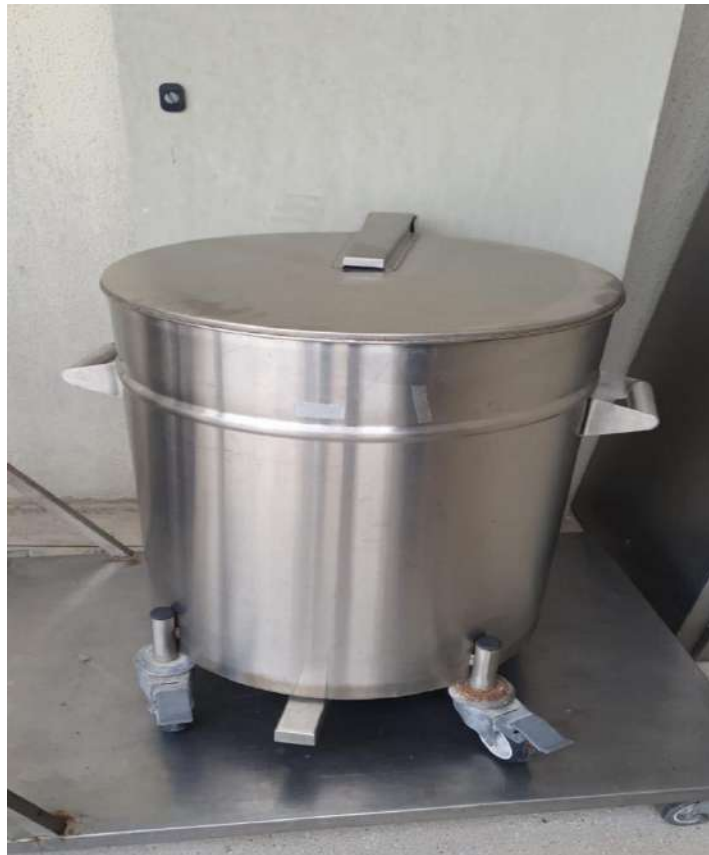
CARRO INOX, COM RODAS, PARA COLETA DE RESIDUOSGRUNOX. Tombo - 133397