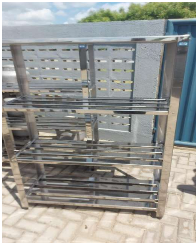
ESTANTE MADEIRA OU METALICA Estante em Aço, Perfurada, 4 PlanosUS15. Tombo - 132832