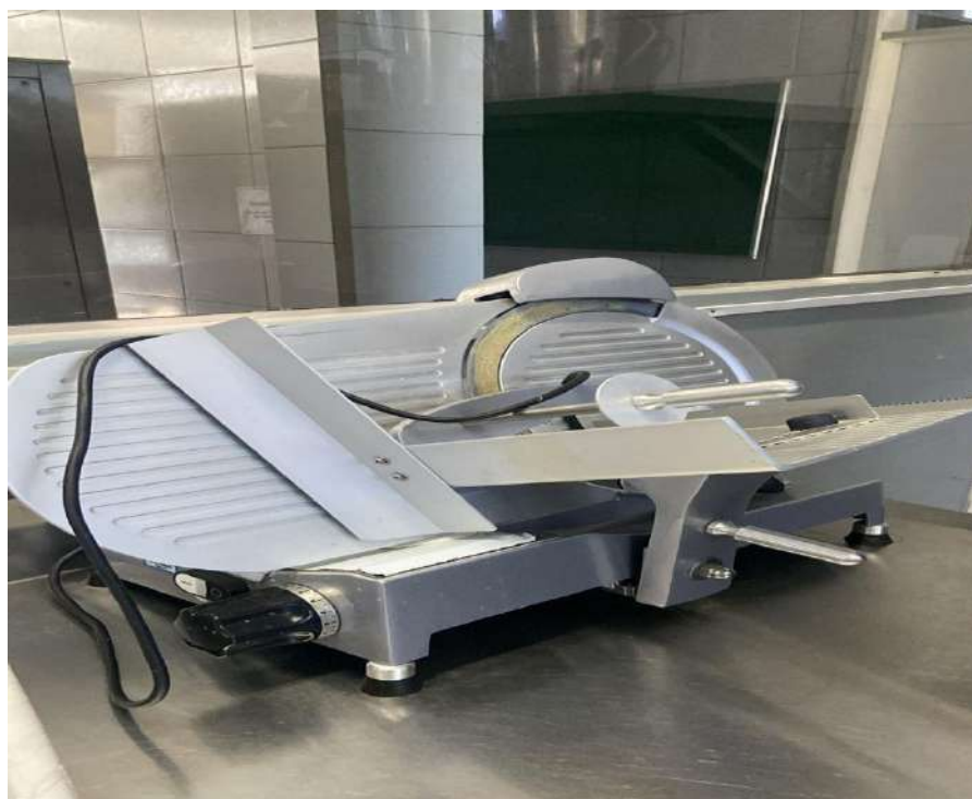
CORTADOR DE FRIOS AUTOMÁTICO SIRMAN. Tombo - 180317 (funciona)