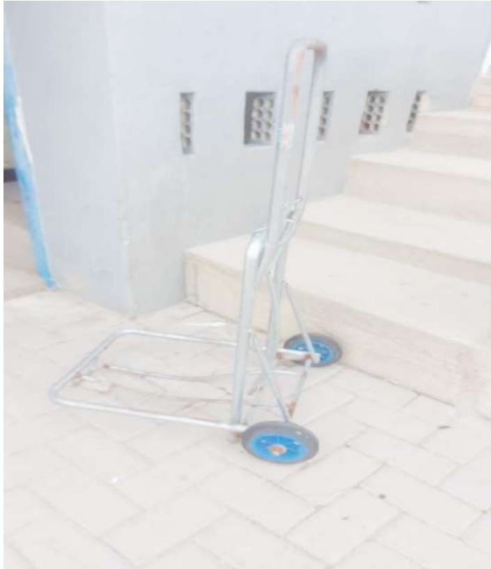
Tombo - 057936