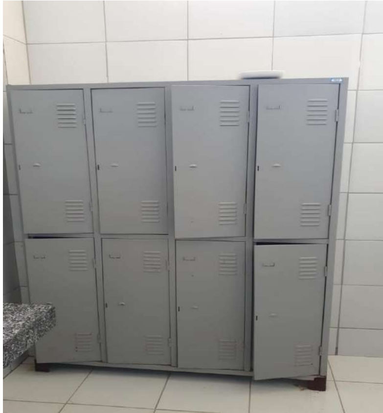
Tombo - 132941