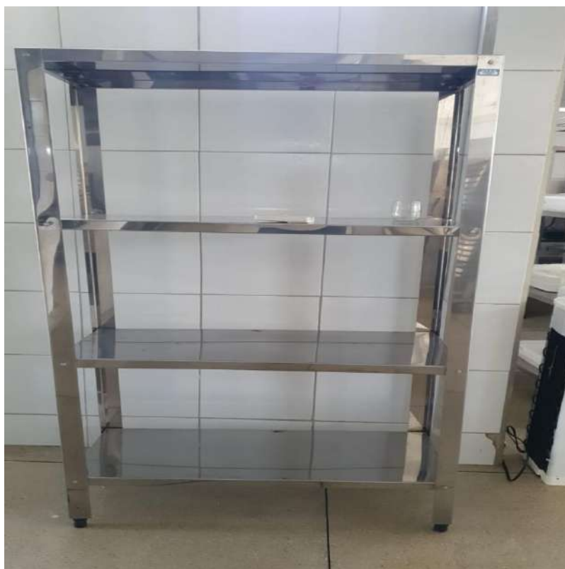
ESTANTE MADEIRA OU METALICA ESTATE EM ACO, LISA, 4 PLANOSUSI14.