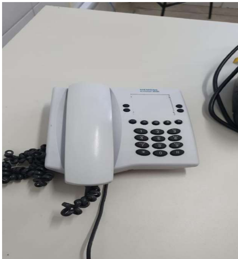
Tombo - 047128 (funciona)