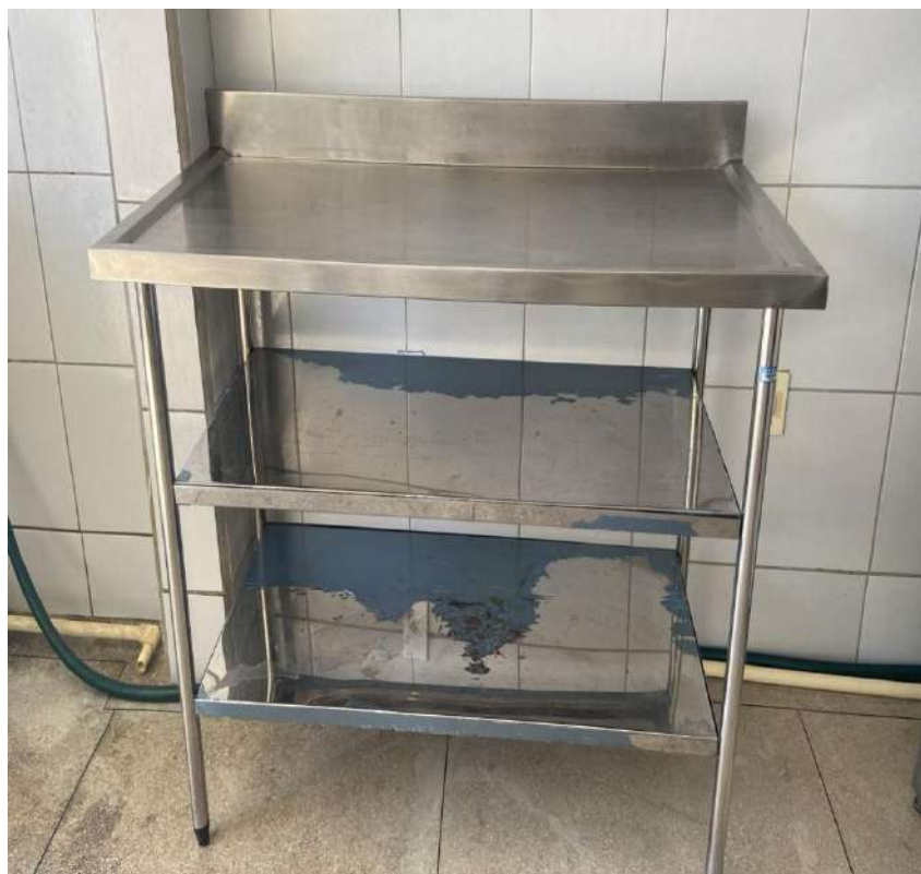
MESA AUXILIAR P/COZINHA EM ACO, COM DUAS PRATELEIRASSUPREME. Tombo - 132944