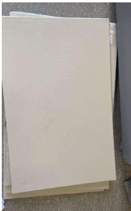
TÁBUA CREME VERDURA 04 UNIDADES