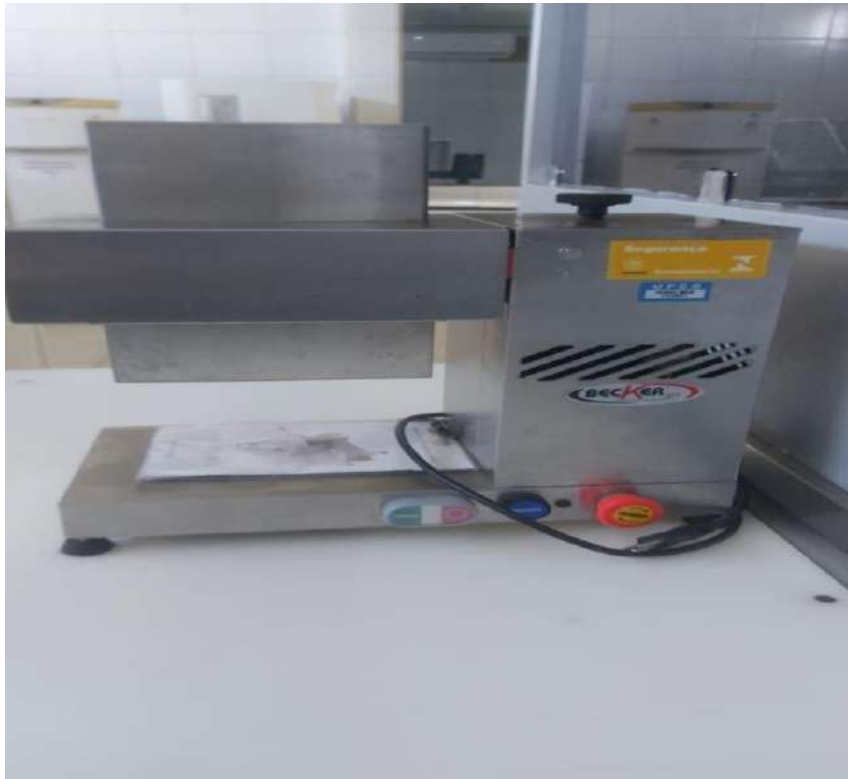
AMACIADOR DE CARNEEM ACO INOX BECKER .Tombo - 132861(não funciona, precisa de manutenção)