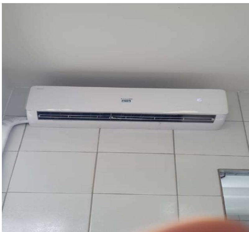
CONDICIONADOR DE AR SPLIT, 18000 BTUSELGIN. Tombo - 135188