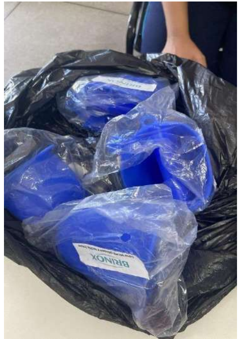
LUVAS JACARÁ AZUL 4 UNIDADES