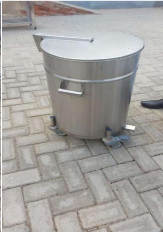
CARRINHO COLETOR DE LIXO CARRO INOX, COM RODAS, PARA COLETA DE RESIDUOSGRUNOX.Tombos - 133401 e 133399