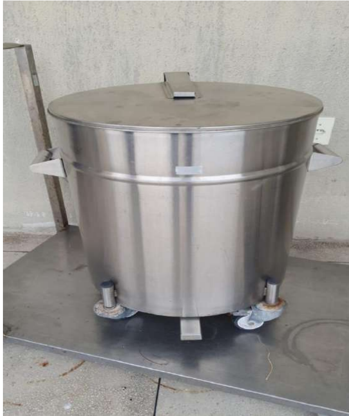
CARRO INOX, COM RODAS, PARA COLETA DE RESIDUOSGRUNOX. Tombo - 133398