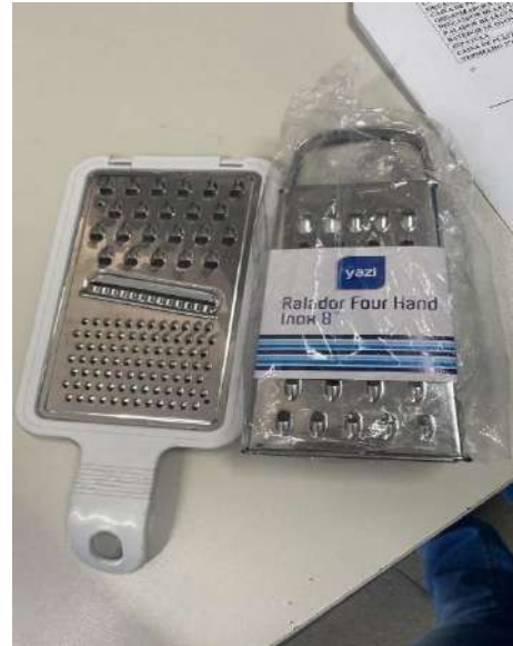
RALADOR DE LEGUMES 02 UNIDADES