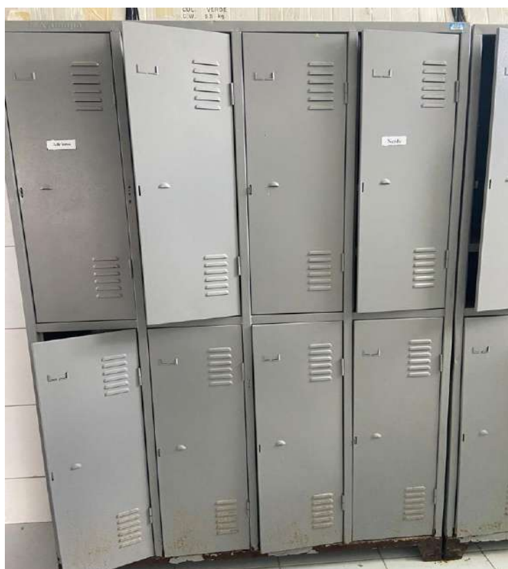
Tombo - 132940 (com ferrugem)