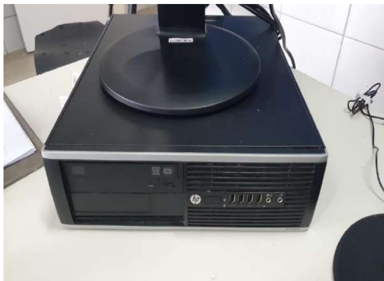
Gabinete Tombo – 121395 (funciona)