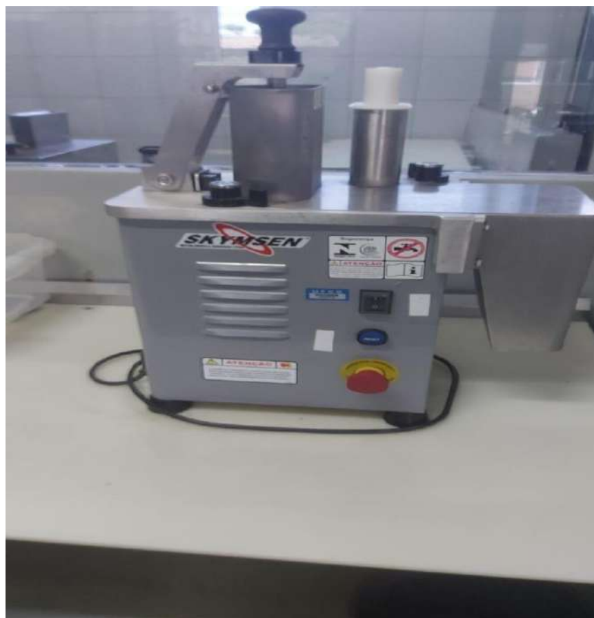
DIVERSOS USAVEIS EM COPA E COZINHA MULTIPROCESSADOR DE ALIMENTOS, PA&SENSKYMSEN. Tombo – 133712 (Não funciona, precisa de manutenção)