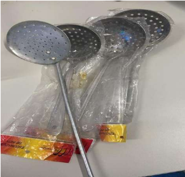
ESCUMADEIRA 04 UNIDADES