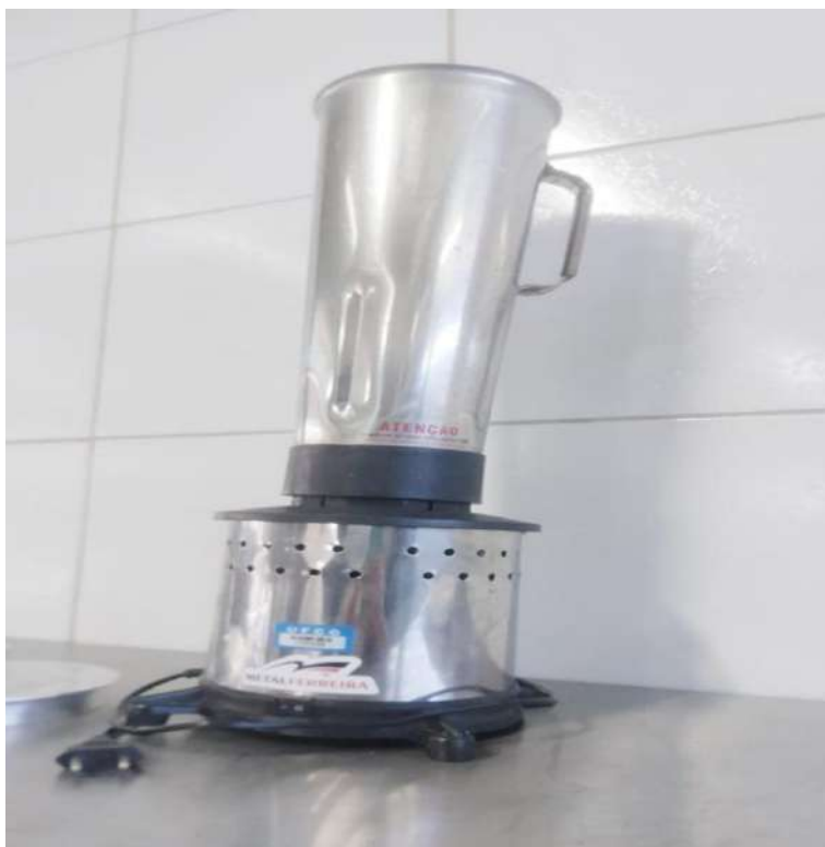
LIQUIDIFICADOR INDUSTRIAL 4 LITROS METAL FERREIRA. Tombo - 135358 (queimado)