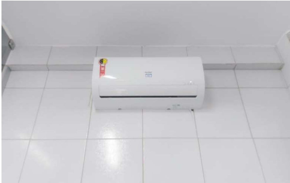
Tombo – 135254 (funciona)