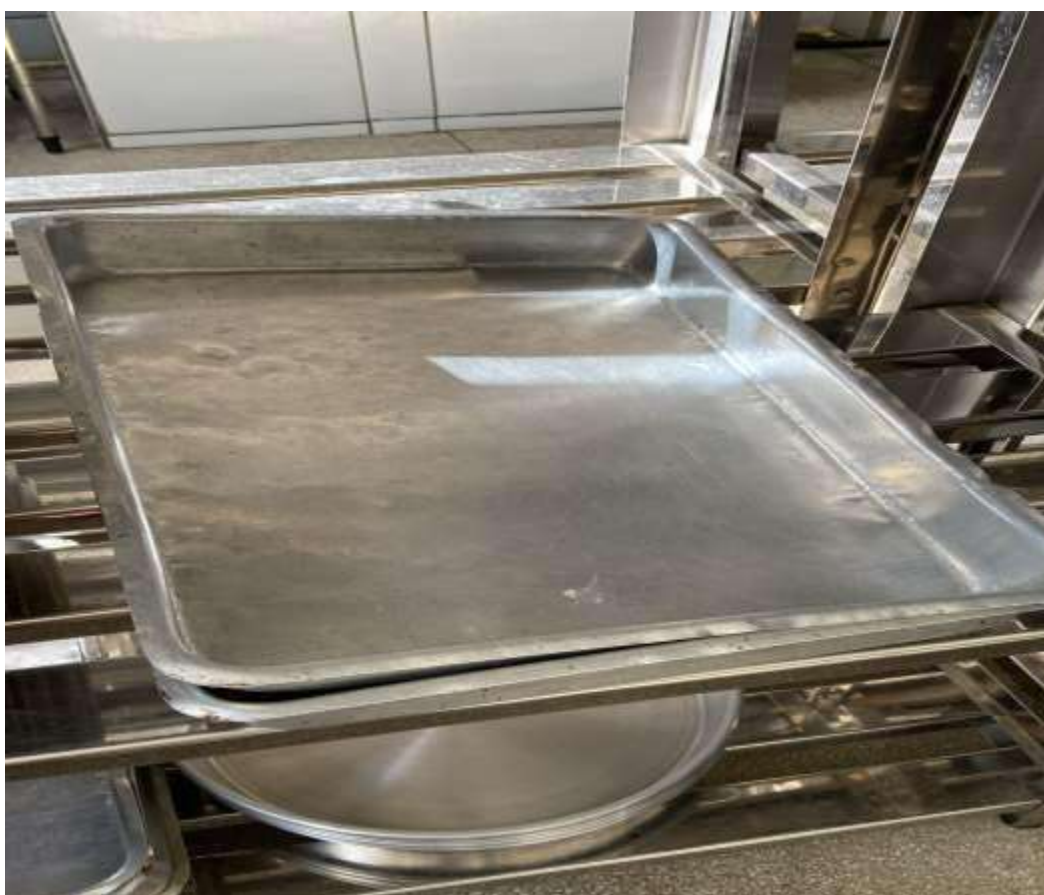
FORMA M 02 UNIDADES