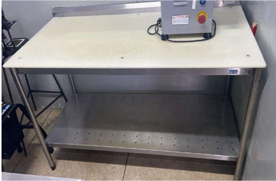
Tombo - 132847