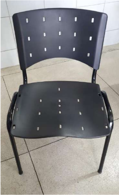
Tombo - 188273