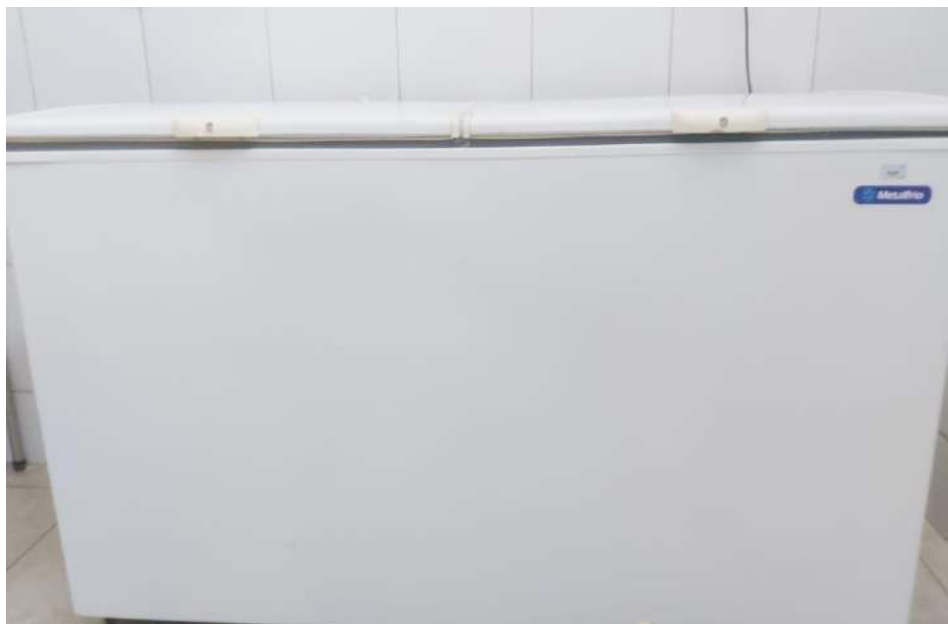
FREEZER HORIZONTAL, BRANCOMETALFRIO. Tombo - 132431 (funciona)