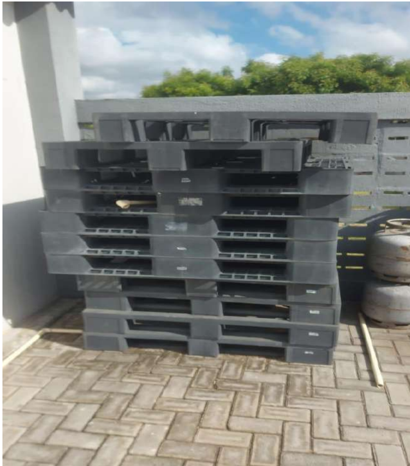
ESTRADO MODULAR, POLIPROPILENOPLAST. Tombos - 100782, 099168, 099166, 099164, 100781, 100785