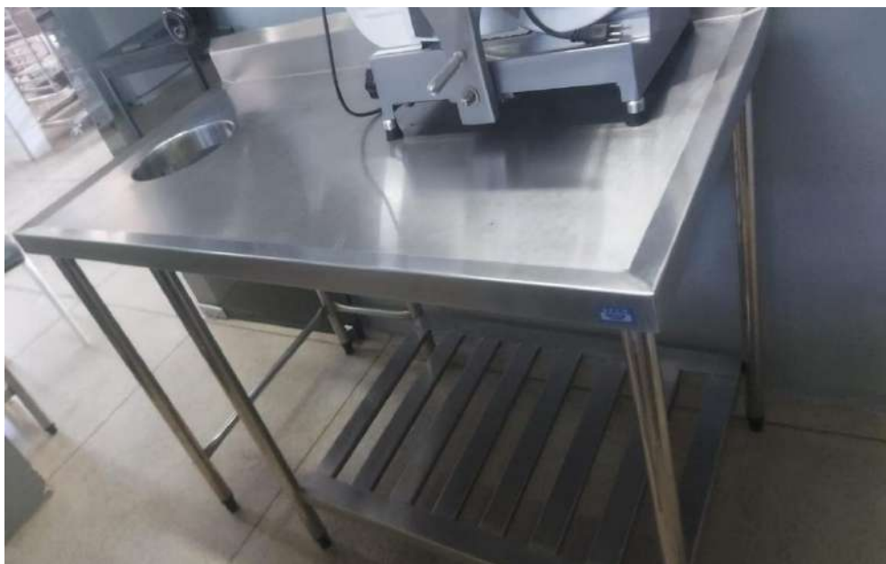
MESA EM ACO INOX COM FURO PARA TRITURADORGRUNOX. Tombo - 133409