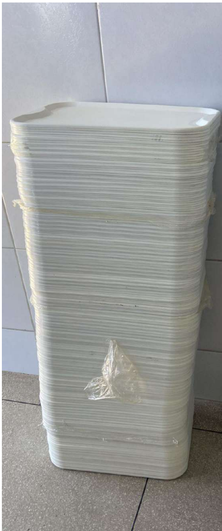
BANDEJAS 220 UNIDADES