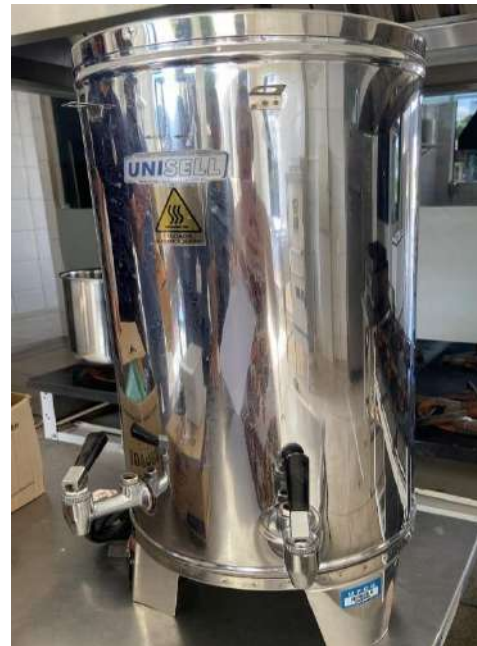
Tombo – 098906 (precisa de manutenção)