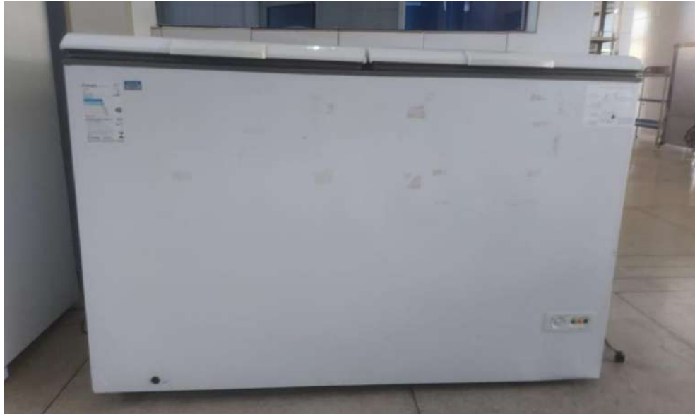
Freezer Tombo – 073038 (funciona)