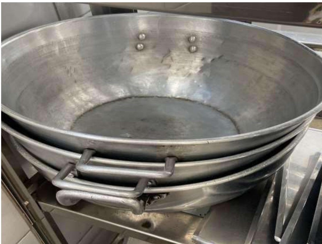
TACHO GRANDE 03 UNIDADES.