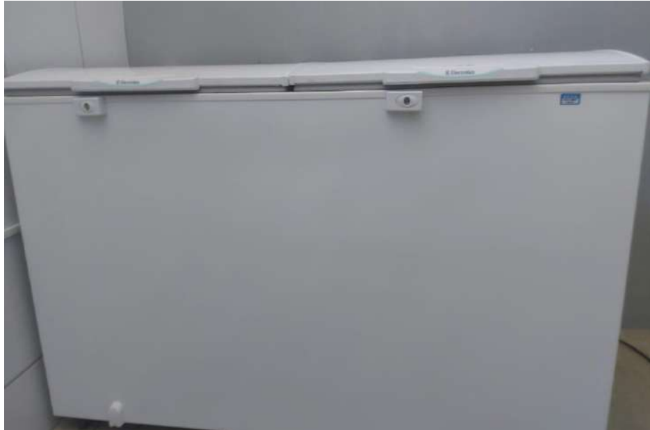
FREEZER HORIZONTAL -500ELECTROLUX. Tombo – 180441 (não funciona, precisa de manutenção)