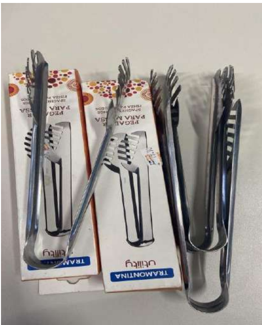
PEGADOR DE MACARRÃO 06 UNIDADES.