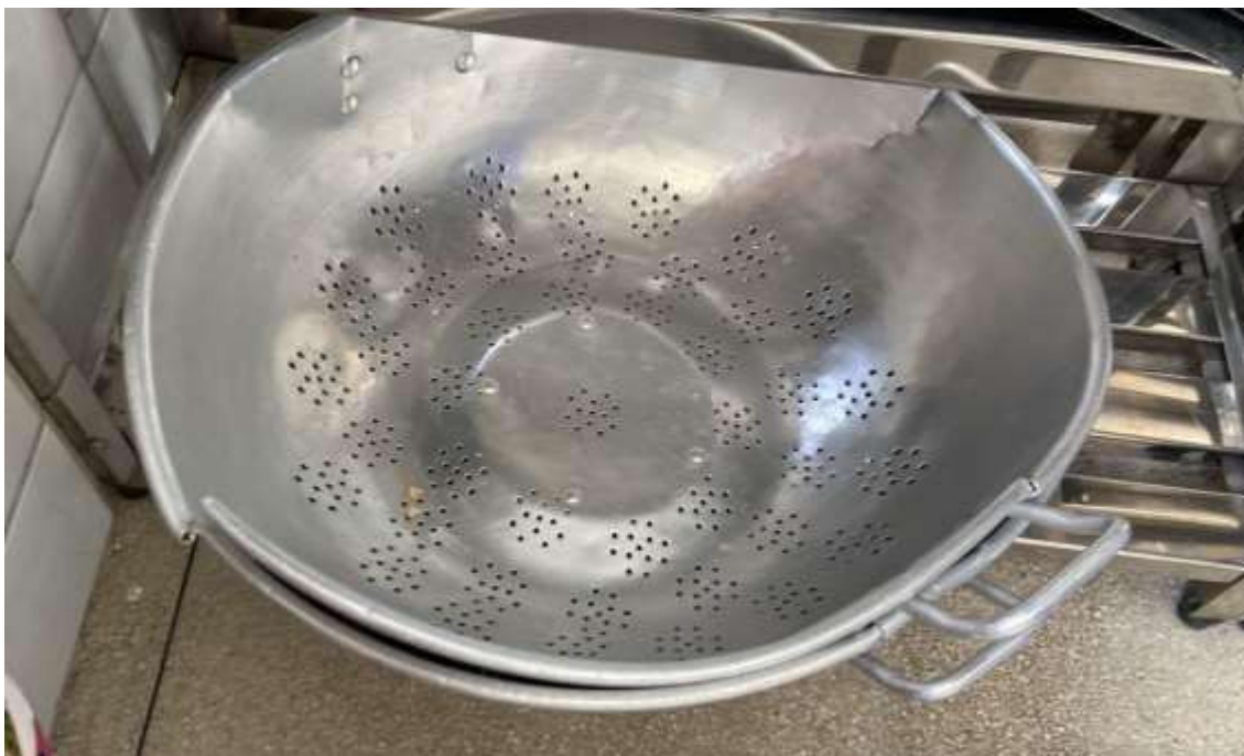
ESCORREDEIRA DE ARROZ 02 UNIDADES.