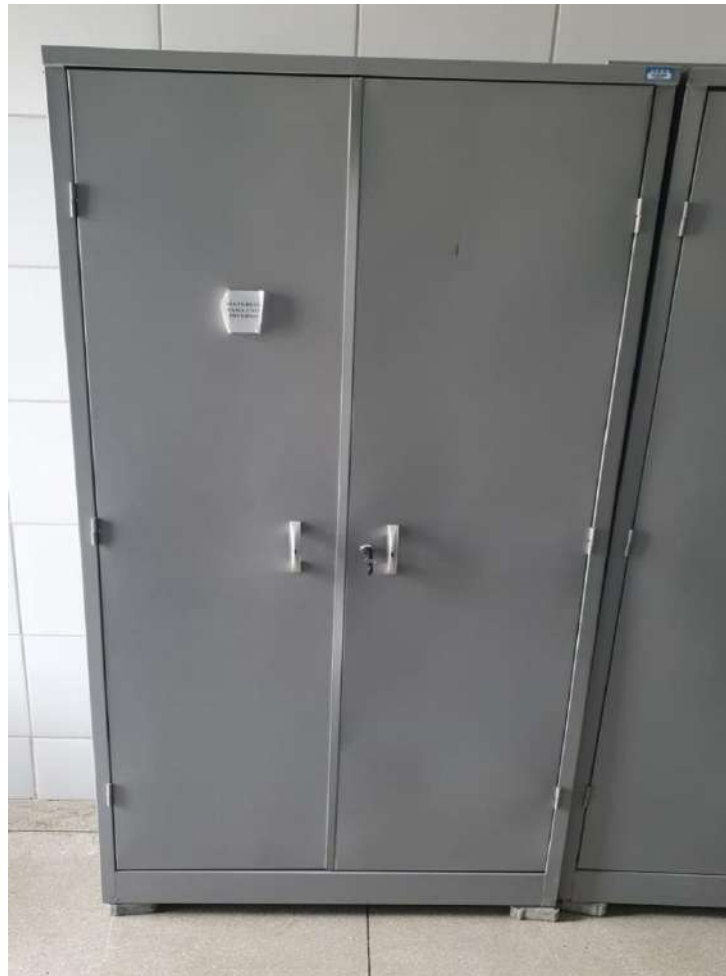
Tombo - 099651 (bom)