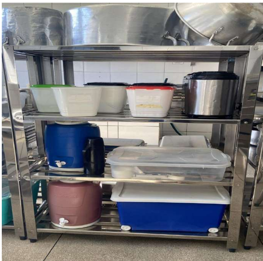
ESTANTE MADEIRA OU METALICA ESTANTE EM ACO, PERFURADA, 4 PLANOSUSI15. Tombo - 132830