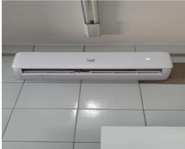
CONDICIONADOR DE AR SPLIT, 18000 BTUSELGIN. Tombo – 135187 (funciona)