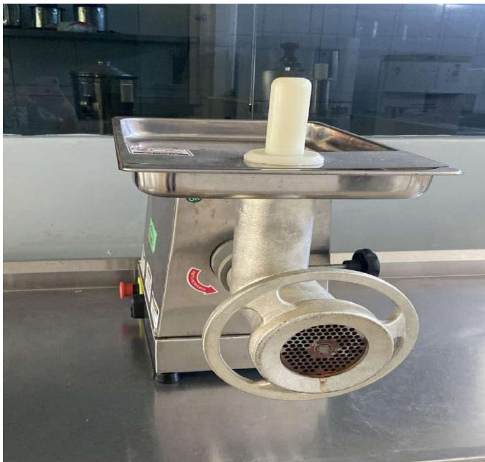
Não conseguiu ler o Tombo (precisa de manutenção)