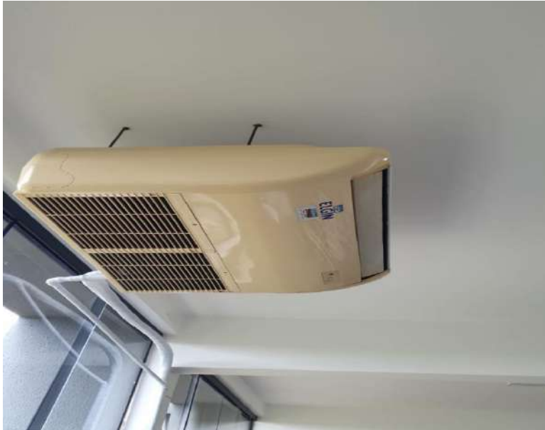
Tombo – 107417 (não funciona, precisa de manutenção)