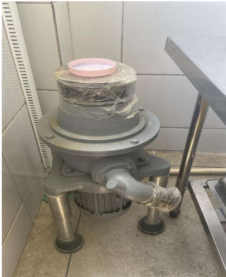
Tombo - 132684