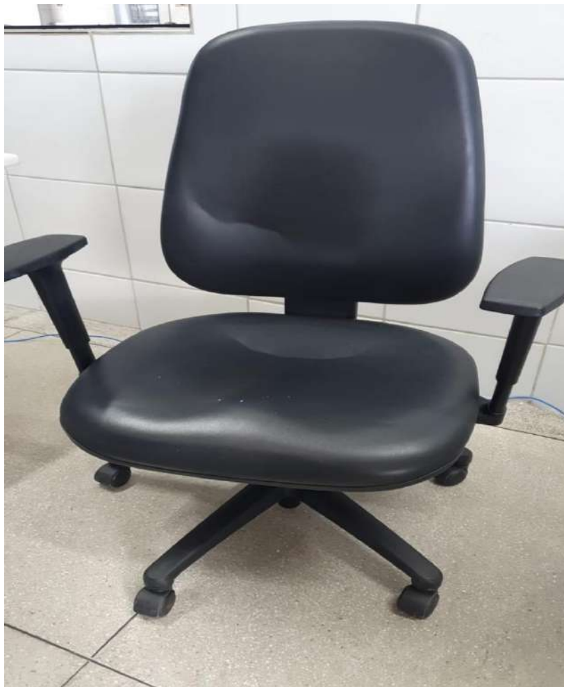
Tombo - 170672