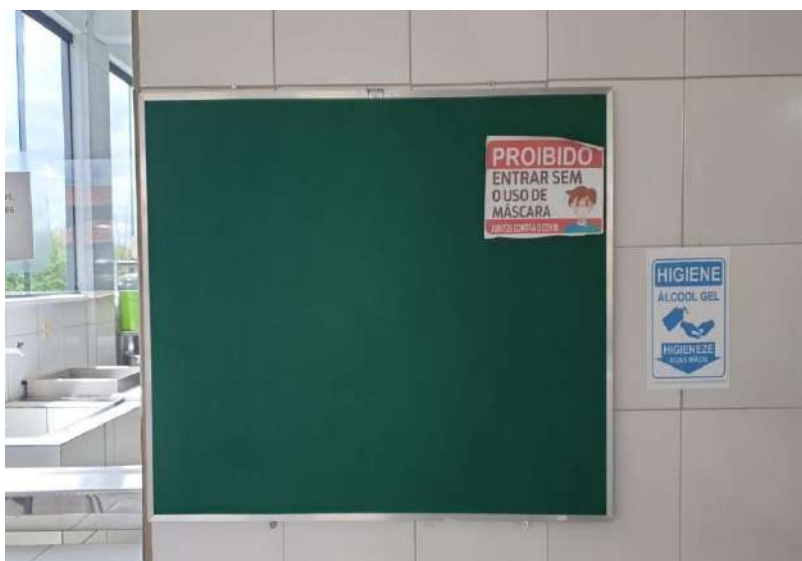
Tombo - 098883