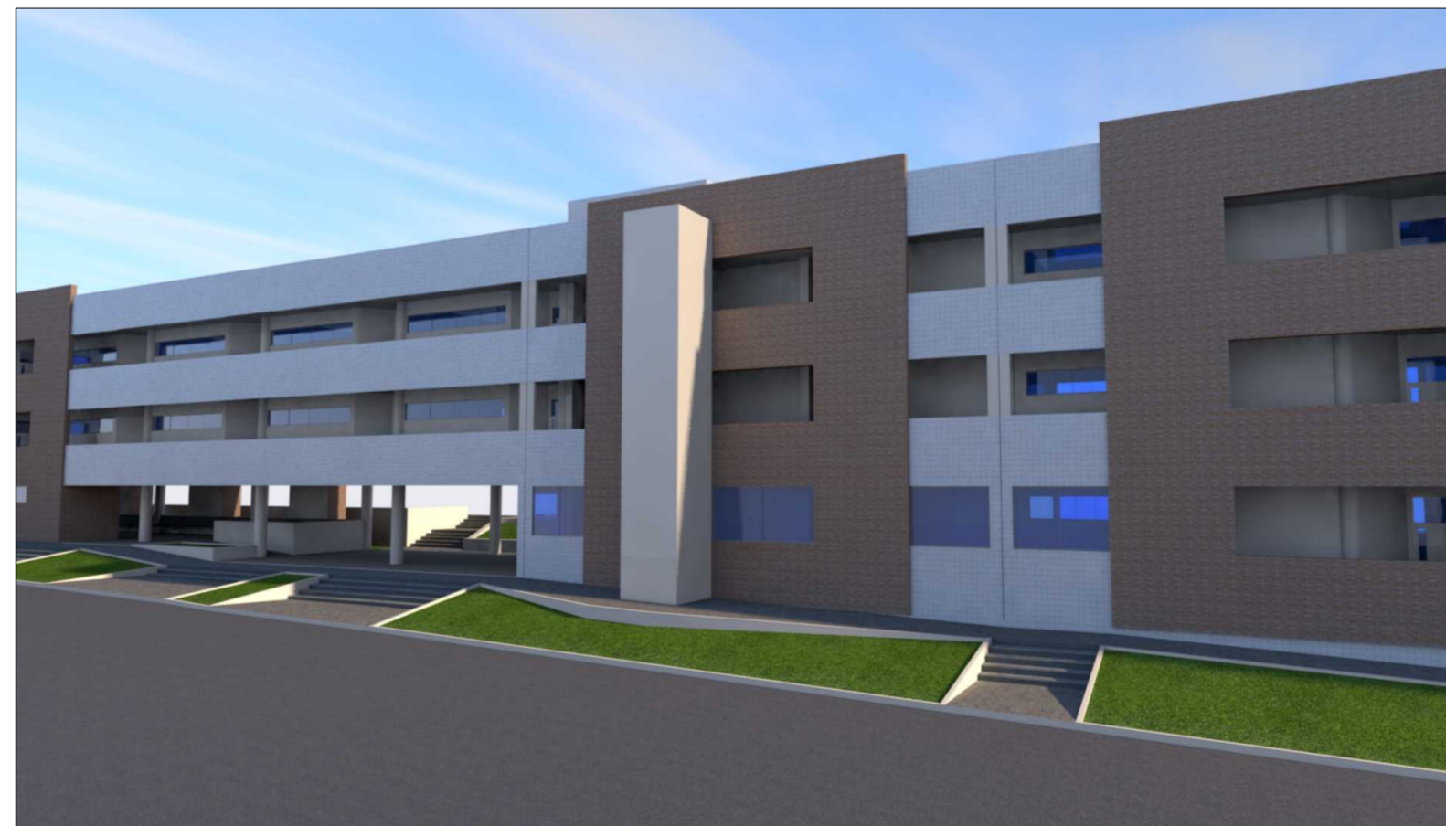
Imagem 02 ELEVADOR - BLOCO BG

UFCG - Universidade Federal de Campina Grande PREFEITURA UNIVERSITÁRIA / SETOR DE PROJETOS Rua Aprígio Veloso, nº 882, Bairro: Bodocongó, Campina Grande - CEP 58429-900 Telefone: (83) 2101.1180 / 210.1081 | e-mail: secretaria.prefeitura@ufcg.edu.br