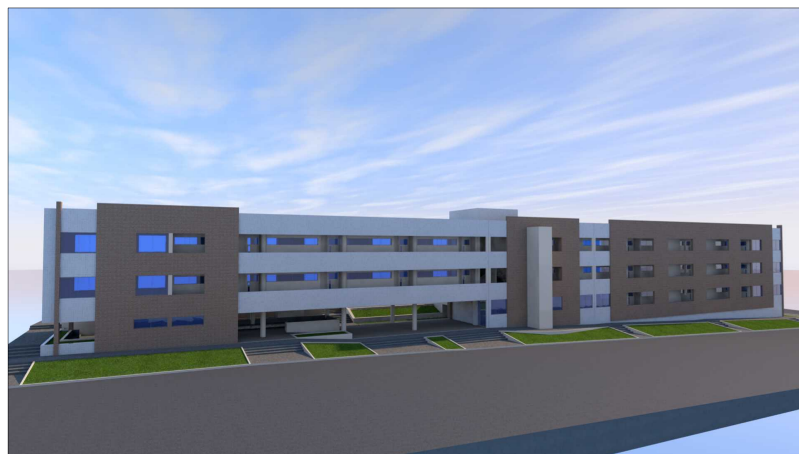
Imagem 01 ELEVADOR - BLOCO BG